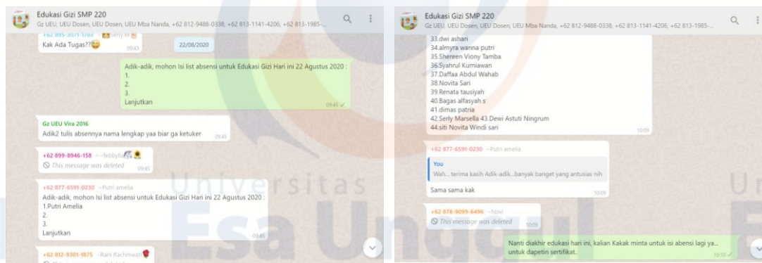
Gambar 2. Absensi melalui Whatsapp Group

Sebelum menyampaikan materi edukasi pertama, siswa-siswi diminta untuk mengerjakan soal melalui pre-test secara online menggunakan http://testmoz.com/5190160 . Waktu yang diberikan kepada siswa-siswi untuk mengerjakan pre-test sekitar 10 menit. Siswa-siswi cukup antusias mengisi soal pre-test tersebut, karena akan ada hadiah bagi peserta dengan nilai tertinggi. Dari hasil pre-test , didapatkan siswa-siswi yang mengikuti pre-test sebanyak 31 orang dengan rata-rata nilai 51.29. Berikut hasil pre-test siswa-siswi SMPN 220 Jakarta.