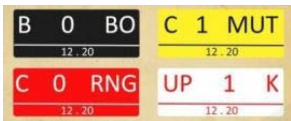
Gambar 2. Jenis warna plat nomor kendaraan, http://banjarmasin.tribunnews.com/2018/03/08/arti-warna-pelat-nomor-kendaraan-di-indonesia-jenis-ini-jarang-ditemui?page=3 , di unduh 15 agustus 2018, 12:56 wib

Akrilik jenis ini merupakan pilihan yang paling baik nuntuk membuat plang, display dan lainnya. Kemudian pemilihan material kedua adalah material plat logam. Yang dimaksud adalah material plat nomor kendaraan roda empat. Pada material plat ini sebelumnya telah digunakan selama bertahun-tahun oleh Batik Plentong. Berdasarkan hasil wawancara dengan pemilik Batik Plentong, alasan penggunaan material plat kendaraan untuk papan tanda informasi di ruang usaha pembatikan dikarenakan keawetan dari kualitas material tersebut. Penggunaan material plat kendaraan pada papan tanda informasi dimaksudkan juga ingin menjaga identitas ciri khas papan penanda yang menggunakan material yang sama di jalan-jalan protokol kota Yogyakarta (Gambar 2).