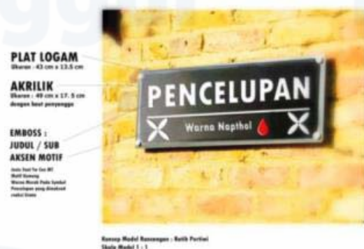
Gambar 7. Pemodelan alternatif pertama.

Selanjutnya pada Gambar 7, diuraikan mengenai pemodelan alternatif pertama. Yang terdiri antara lain, penggunaan material, ukuran yang diterapkan pada media akrilik, dan teknik aplikasi menggunakan cutting laser.