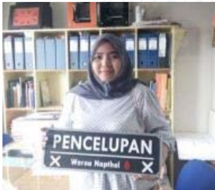
Gambar 8. Hasil akhir pemodelan alternatif pertama.

Langkah pertama, lembaran akrilik dipotong base atau dasar sesuai dengan ukuran yang telah ditentukan. Langkah kedua, dilakukan tahapan cutting terutama pada bagian simbol dan huruf sesuai dengan desain yang telah ditentukan.