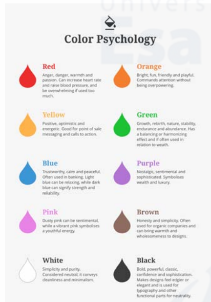
Gambar 5. Psikologi Warna, https://convertkit.com/color-theory-for-bloggers/ , diunduh 15 agustus 2018, 11. 54 wib

pengunjung yang ingin mempelajari menggunakan canting dan lilin di khususnya bagi kelas kursus. Namun lain halnya pada proses memola diberikan warna hijau pada simbol tersebut. Yang memiliki makna, bahwa dalam penggunaan warna rambu lalu lintas warna hijau adalah diperbolehkan jalan.