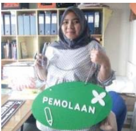
Gambar 10. Hasil akhir pemodelan alternatif kedua.

Selanjutnya berdasarkan Gambar 10, diuraikan mengenai pemodelan alternatif kedua. Yang terdiri antara lain, penggunaan material, ukuran yang diterapkan pada media akrilik, dan teknik aplikasi menggunakan cutting laser . Selain itu, merupakan hasil akhir dari pemodelan untuk alternatif kedua.