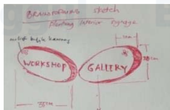
Gambar 4. Sketsa kasar pemodelan alternatif kedua.

Bentukan pada motif batik kawung dapat dipandang sebagai hasil refleksi (pencerminan) bentuk dasar. Hasil pencerminan Gambar 1 pada garis x, y, dan z menghasilkan orientasi bentuk sebagai berikut (Gambar 2, Gambar 3 dan Gambar 4). Hal ini penulis terapkan seperti pada Gambar 4. Bentuk dasarnya adalah elips dan titik. Berdasarkan transformasi yang dihasilkan dari motif kawung, maka pemodelan pada papan tanda informasi membentuk geometris yang lebih disederhanakan menjadi bentuk elips.