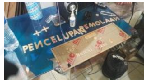
Gambar 6. Proses cutting laser .

Langkah keenam, di bagian lembar akrilik sisi depan dan belakang dilakukan pengeboran guna dipasang empat baut untuk ditempel pada dinding tembok. Tahapan di atas dapat dilihat pada Gambar 6, proses cutting laser .