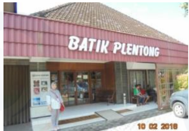
Gambar 1. Batik Plentong Yogyakarta.

Berdasarkan wawancara mendalam, survey Batik Plentong Yogyakarta (Gambar 1), dan diskusi dengan anggota maka ditentukan sebuah hasil penelitian, berikut ini akan diuraikan dari aspek elemen desain grafis dan aspek material. Dalam tinjauan elemen desain komunikasi visual dari aspek grafis yang terbentuk dari papan tanda informasi yang terdapat pada signage Batik Plentong. Desain Komunikasi Visual dapat dikatakan sebagai seni menyampaikan pesan dengan bahasa rupa yang disampaikan melalui media papan tanda informasi berupa desain yang bertujuan menginformasikan, mempengaruhi hingga mengubah perilaku pengunjung sesuai dengan tujuan yang diinginkan.