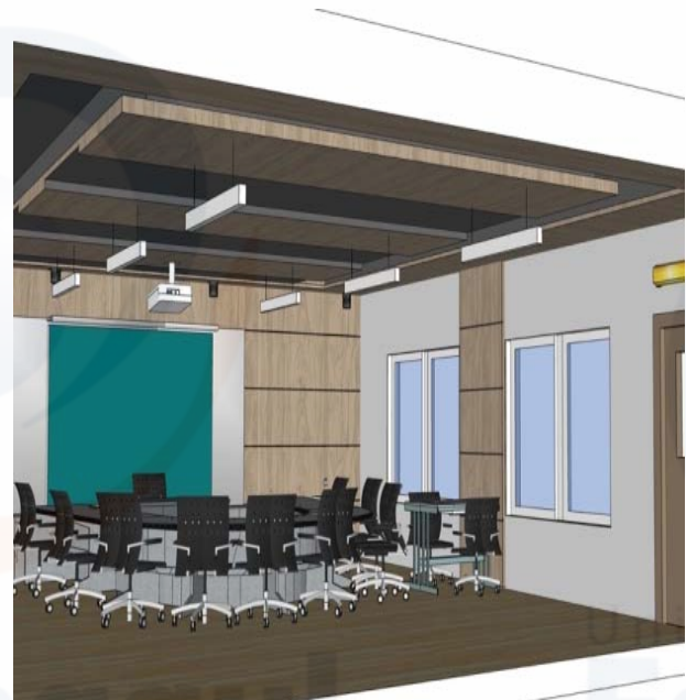
Gambar 2 Hasil 3D ruang kelas pada tampak perspektif.

Secara umum gaya perancangan interior untuk Pusat Pendidikan dan Rehabilitasi Tunarungu yang tepat adalah hasil dari pendekatan perilaku pada interior dengan filosofi “ Hearing Visually ” dengan konsep kontemporer yang menggabungkan antara konsep masa kini, dan masa depan. Desain ini sesuai dengan