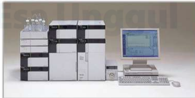
Gambar 1. Alat Instrumen HPLC