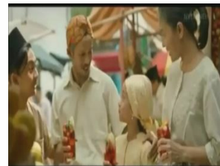
Gambar 3. Orang-orang di pasar menikmati Marjan Cocopandan.

Saat sedang menikmati sirop Marjan, Buto Ijo tiba-tiba datang dan mengacaukan suasana saat itu. Peristiwa berkejar-kejaran antara Buto Ijo dan Timun Mas pun dimulai lalu berlanjut hingga episode kedua. Paham dengan bahaya yang akan dihadapi anaknya, Ibu Timun Mas meminta anaknya tersebut untuk melarikan diri dari Buto Ijo. Tak lupa, sang ibu memberikannya beberapa benda ajaib.