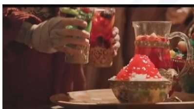
Gambar 13. Aneka varian rasa Sirop Marjan dihadirkan di kerajaan Purbasari.

Akhir cerita yang ditampilkan dalam iklan tidak jauh berbeda dengan versi aslinya, yakni Purbasari memaafkan kesalahan kakaknya dan takhta dikembalikan kepada Purbasari. Namun, dalam iklan, kemunculan brand Marjan dihadirkan kembali pada akhir cerita. Perdamaian antara Purbasari dan Purbararang serta pengembalian takhta kerajaan kepada Purbasari dirayakan dengan menikmati segarnya Marjan dalam berbagai rasa dan olahannya (Gambar 13). Kebahagiaan orang-orang istana terlihat ketika mereka menikmati Sirop Marjan (Gambar 14). Adegan ini menyiratkan bahwa Sirop Marjan adalah salah satu minuman khas kerajaan yang perlu disajikan pada acara-acara besar kerajaan.