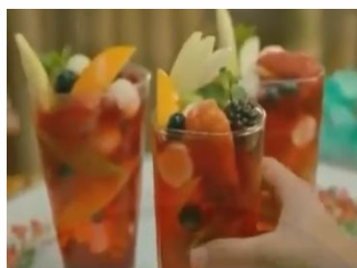
Gambar 2. Sirop Marjan cocopandan sebagai pelepas dahaga pada siang hari.