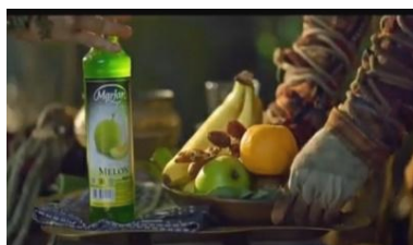
Gambar 11. Sirop Marjan rasa melon yang mengakrabkan Purbasari dan Lutung Kasarung.

Episode kedua dalam iklan tersebut menggambarkan hari-hari yang dilalui Purbasari di hutan. Dalam pengasingannya itu, Purbasari bertemu dengan manusia kera yang juga terkena kutukan. Manusia kera itu bernama Lutung Kasarung. Singkat cerita, keduanya menjadi akrab. Pada peristiwa ini, dekonstruksi cerita terlihat dari munculnya brand Sirop Marjan sebagai simbol keakraban antara Purbasari dan Lutung Kasarung (Gambar 11). Keduanya menikmati Sirop Marjan rasa melon di hutan (Gambar 12). Dengan kekuatannya, Purbasari berhasil menyajikan olahan Sirop Marjan, yakni es buah. Pada iklan tersebut juga ditegaskan bahwa kutukan Purbasari dan Lutung Kasarung hilang setelah mereka menikmati sirop Marjan. Setelah kutukan keduanya hilang, mereka menuju ke kerajaan Purbasari.