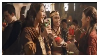
Gambar 14. Purbasari dan seluruh orang di kerajaan menikmati Marjan bersama.

Tabel di bawah ini menjelaskan analisis dekonstruksi cerita rakyat Lutung Kasarung dalam iklan Marjan yang telah mengalami beberapa pengembangan dari segi penyajian kemenarikan cerita. Sama halnya seperti cerita rakyat Timun Mas, secara umum, alur cerita Lutung Kasarung tidak banyak berubah dan tidak menghilangkan unsur tradisional dari cerita rakyat tersebut. Inti dan pesan cerita tetap tersampaikan dengan baik dalam durasi waktu yang singkat. Strategi kemunculan merek Marjan juga ditampilkan pada momen-momen penting kerajaan. Marjan hadir untuk merayakan kebaikan, kebersamaan, dan keakraban.