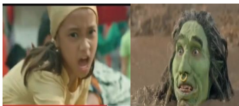
Gambar 7. Timun Mas menyelamatkan Buto Ijo.

Pada episode ketiga, iklan yang dihadirkan masih berkaitan dengan konflik yang terjadi antara Timun Mas dan Buto Ijo. Jalan cerita yang ditampilkan dalam bagian ini hampir semuanya telah didekonstruksi. Setelah berbuka puasa, tali yang mengikat Buto Ijo lepas. Timun Mas kembali berlari menghindari Buto Ijo. Peristiwa itu terjadi selama beberapa hari. Hingga akhirnya Timun Mas terdesak. Dalam kondisi tersebut, ia mengeluarkan senjata terakhirnya, yakni terasi yang kemudian berubah menjadi lumpur isap dan siap menelan Buto Ijo. Namun, apa yang terjadi? Timun Mas tidak tega. Ia segera meminta bantuan warga yang sedang berkumpul dan mempersiapkan perayaan Idulfitri untuk menyelamatkan Buto Ijo (Gambar 7). Alhasil, Buto Ijo berhasil selamat. Ia mengucapkan terima kasih kepada Timun Mas. Keduanya pun berdamai. Ketika Hari Lebaran tiba, Buto Ijo beserta keluarga Timun Mas dan seluruh warga menikmati Sirop Marjan bersama-sama dengan berbagai macam olahan dan varian rasa (Gambar 8)