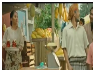
Gambar 1. Sirop Marjan yang disajikan Ibu Timun Mas.

ketika Timun Mas memperlihatkan kemampuan bela dirinya di sekitar dagangan ibunya. Hal itu membuat banyak orang tertarik untuk melihat atraksi yang dilakukan Timun Mas. Dalam kondisi itulah, sang ibu muncul dengan membawa Sirop Marjan rasa cocopandan dengan aneka buah segar di dalamnya untuk bisa dinikmati banyak orang (Gambar 1). Pada momen inilah sirop Marjan muncul sebagai pelepas dahaga pada siang hari atas aktivitas yang dilakukan orang-orang di pasar tersebut (Gambar 2). Aktivitas ketika sang ibu menyajikan sirop Marjan ini merupakan bentuk pengembangan plot sebagai strategi untuk memunculkan merek ( brand ) Marjan itu sendiri, khususnya rasa cocopandan (Gambar 3). Tentu saja peristiwa ini sangat berbeda dengan cerita asli yang selama ini berkembang.