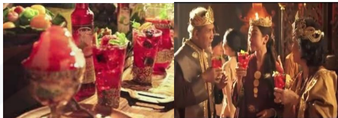
Gambar 10. Sukacita orang-orang kerajaan dalam menikmati Marjan cocopandan.

Ketika semua orang sedang bersuka cita menikmati Marjan rasa cocopandan, peristiwa tak terduga pun terjadi. Terpilihnya sang putri bungsu untuk naik takhta ternyata menyulut kecemburuan kakak tertua yang bernama Purbasari. Bahkan, ia sampai tega mencelakai adiknya sendiri. Purbasari mendapat kutukan penyakit kulit yang menyebabkan ia harus pergi meninggalkan istana. Jalan cerita yang disajikan pada bagian ini sama persis dengan cerita aslinya.