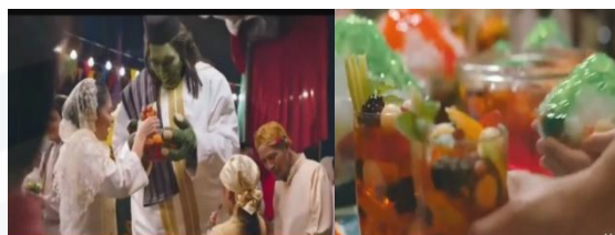
Gambar 8. Timun Mas dan Buto Ijo menikmati Sirop Marjan beraneka rasa di Hari Lebaran.

Pada momen Idulfitri brand Sirop Marjan kembali muncul sebagai salah satu sajian yang menyegarkan. Dalam konteks yang lebih luas, misalnya, di masyarakat, sirop seolah menjadi ciri khas minuman yang perlu ada saat Lebaran, tak terkecuali Sirop Marjan. Kemunculan brand Marjan di hari raya sekaligus sebagai akhir dari episode Timun Mas.