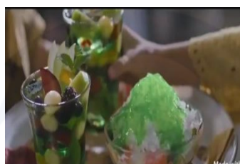
Gambar 5. Aneka olahan Sirop Marjan rasa melon.