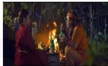
Gambar 12. Purbasari dan Lutung Kasarung menikmati Marjan rasa melon di hutan.