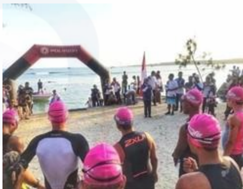
Gambar 7 Triathlon lintas alam (Cross Triathlon)

Kegiatan tersebut merupakan cabang olahraga yang terdiri dari lomba renang, balap sepeda dan lompat gunung serta tantangan alam Tanjung Lesung. Event ini merupakan salah satu bentuk upaya yang di lakukan guna menarik wisatawan untuk berkunjung kembali bahwa objek wisata Tanjung Lesung sudah mulai pulih sejak terjadinya bencana tsunami.