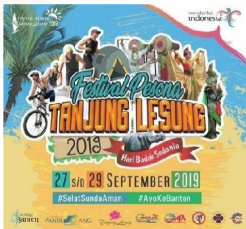
Gambar 8 Festival Tanjung Lesung

Pemilihan media massa yang sesuai dengan sasaran publik sangat penting dalam tahap persiapan dan penyebaran informasi, seperti yang di lakukan Divisi Destinasi Wisata Provinsi Banten media massa yang di gunakan untuk mempublikasikan suatu hal dengan tujuan memperkenalkan kepada masyarakat biasanya menggunakan printed media contohnya seperti pemasangan billboard di jalan, leaflet, surat kabar, televisi lokal dan radio lokal. Paling tidak dapat membuat rasa penasaran masyarakat dari yang di sampaikan media tersebut.