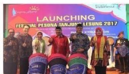
Gambar 10 Berita Media

Dalam hal ini peneliti berpendapat bahwa peran dari strategi komunikasi Divisi Destinasi Wisata cukup penting