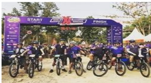
Gambar 5 Mountain bike cross country.

Dinas Pariwisata Provinsi Banten khususnya Divisi Destinasi Pariwisata kembali menggelar Festival Tanjung Lesung. Setiap tahunnya Festival Tanjung Lesung mengusung tema yang berbeda, Gelaran yang berlangsung di pinggir pantai ini sekaligus untuk menunjukkan bahwa Pantai Tanjung Lesung telah pulih usai diterjang tsunami akhir tahun 2018 lalu. Dimana Festival Tanjung Lesung telah 3 tahun berturut-turut masuk ke dalam kalender 100 event nasional. Festival Tanjung Lesung menghadirkan tiga acara utama yaitu :