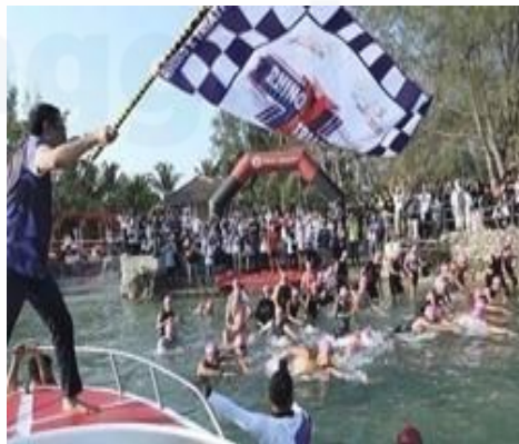
Gambar 6 Rhino Cross Triathlon