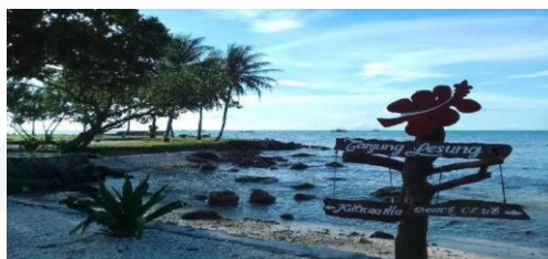
Sebelum Tsunami Gambar 1

Pada tahun 2018 Tsunami yang terjadi di perairan Selat Sunda pada Sabtu (22/12/2018) malam menyapu wilayah Banten, Serang, dan Lampung. Akibat kejadian ini, lebih dari 200 orang meninggal dunia dan wilayah pesisir pantai porak poranda yaitu salah satunya pantai Tanjung Lesung yang terkena dampak dari tsunami yang menyebabkan kerusakan pada objek wisata. Selain itu, rumah hancur, fasilitas umum rusak, Menurut Kepala Dinas Pariwisata melalui artikel Kompas.com ia menyebutkan pasca tsunami hanya 30 persen dari total kunjungan di bulan-bulan sebelumnya. Dimana berkurangnya minat wisatawan untuk berkunjung.