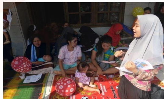
Gambar 3. Edukasi PHBS

Tahap selanjutnya yaitu melakukan praktek langsung cuci tangan pakai sabun dengan memutar video cuci tangan pakai sabun. Menurut Kusumaningtiar dan Vionalita, (2019) menjelaskan bahwa masyarakat yang memiliki perilaku cuci tangan pakai sabun yang kurang hanya melakukan cuci tangan dengan air tanpa menggunakan sabun dan kurangnya pengetahuan masyarakat mengenai waktu-waktu penting untuk mencuci tangan (Kusumaningtiar & Vionalita, 2019). Dalam penyuluhan yang diberikan ada beberapa