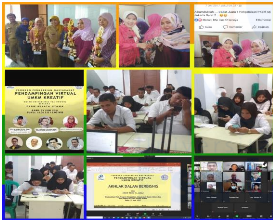
Gambar 2 Forum Group Diskusi dan Kegiatan Peserta didik dan Tutor

Hasil Forum Group Discussion (FGD), kegiatan ini sangat bermanfaat, apalagi bagi kalangan remaja yang masih awam dalam praktek bisnis berdasarkan hukum Islam, mengenal istilah-istilah perekonomian Islam bahkan sampai mengenal contoh-contoh dari lembaga perekonomian umat seperti Lembaga Amil Zakat, Baitul Maal Wa Tamwiil, Bank Syariah dst. Diharapkan ini bisa bekal bagi peserta dalam praktek bisnis khususnya di UMKM peserta pada kemudian hari.