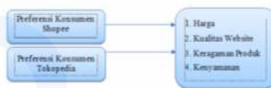
Gambar 2 Model Penelitian

H5: Diduga tidak terdapat perbedaan preferensi konsumen dalam berbelanja online berdasarkan harga, kualitas website, keragaman produk dan kenyamanan. Berdasarkan kerangka hipotesa di atas, dapat digambarkan model penelitian sebagai berikut: