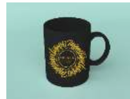
Gambar 21 Mug

Mug menggunakan bahan Keramik berukuran 12cm x 12cm.. Mug digunakan untuk mempromosikan buku secara tidak langsung.