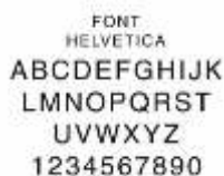
Gambar 2 Helvetica Jody Habibi, 2020