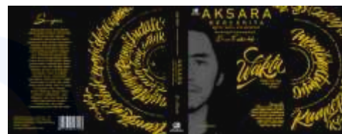
Gambar 6 Cover Buku (Jody Habibi, 2020)

Identitas visual adalah suatu sistem komunikasi visual yang membentuk identitas dari suatu perusahaan, lembaga, mamupun produk. Identitas visual sering digunakan untuk membedakan suatu produk atau jasa dengan produk atas jasa dari pesaing sehingga khalayak umum akan dengan mudah mengidentifikasi suatu produk hanya dengan melihat sebagian dari tampilan visualnya. Identitas visual yang terdapat pada Buku Aksara Bercerita Autobiografi Dimas Fakhruddin diantaranya: