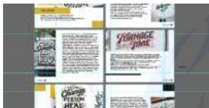
Gambar 8 Layout dengan Grid pada Halaman Buku Jody Habibi, 2020

Layout merupakan salah satu bagian dari kegiatan desain grafis yang mana didalamnya terdapat penataan unsur-unsur grafis pada suatu halaman. Penataan unsur-unsur grafis dalam layout diantaranya berupa penataan elemen grafis dan konten tulisan (serta logo jika ada). Perancangan layout pun mengacu pada prinsip-prinsip desain yang meliputi irama, penekanan, keseimbangan, kesatuan dan proporsi. Dalam hal ini, media yang dibuat menggunakan keseimbangan yang simetris, sederhana, memiliki kesatuan yang baik, serta proporsi.