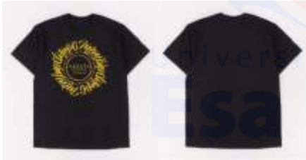
Gambar 17 T-shirt

T-shirt atau baju menggunakan bahan cotton combed 30s dengan tinta sablon rubber. Baju digunakan untuk mempromosikan produk secara tidak langsung.