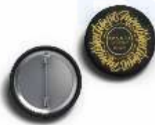
Gambar 19 Pin

Pin menggunakan bahan Plastic berukuran 3,5cm x 3,5cm