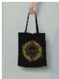
Gambar 18 Totebag

Totebag menggunakan material canvas berukuran 34cm x 29cm.