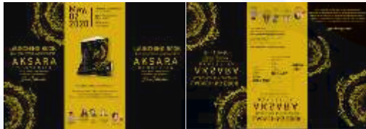
Gambar 12 Brosur

Pada saat acara berlangsung maupun dilain waktu. Brosur ini menampilkan konten yang diberikan buku Aksara Bercerita autobiografi Dimas fakhruddin. dan memberikan informasi detail acara yang diadakan pada saat peluncuran buku.