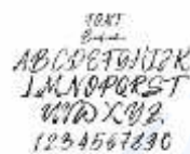
Gambar 3 Beastmachine Jody Habibi, 2020