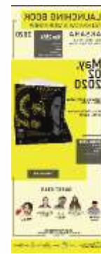
Gambar 15 X Banner

X-Banner yang diaplikasikan dalam bahan albatross dengan ukuran 60cm x 160cm. X-banner akan dipasang ditempat peluncuran buku pada saat acara berlangsung yaitu di Kemala Ballroom