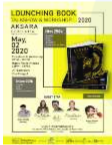
Gambar 11 Poster Promosi

Promosi Digital Media Social Instagram