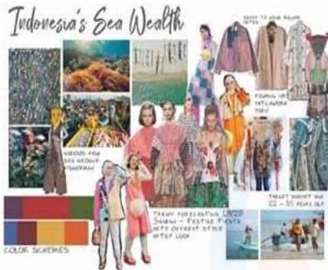
Gambar 3. Moodboard

Hingga memasuki gambar akhir dari desain pakaian yang terpilih.