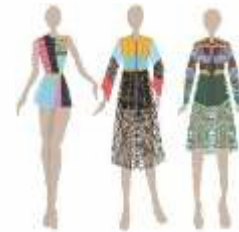
Gambar 6. Gambar Detail

Kemudian mengembangkan gambar sketsa yang ada dan mempersempitnya menjadi beberapa pilihan desain.