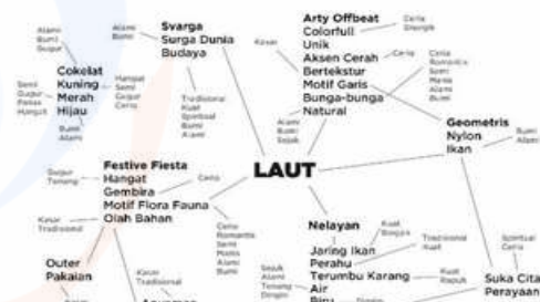
Gambar 2. Mind Mapping