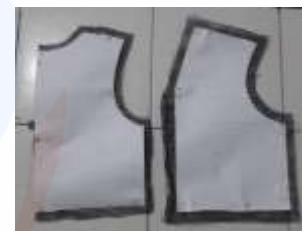
Gambar 8. Pola yang Sudah Terpotong