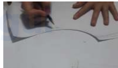
Gambar 7. Pembuatan Pola Pakaian

Setelah terpilih desain yang akan dibuat, maka masuklah ke proses pembuatan pakaian. Pembuatan pakaian ini dimulai dari pengerjaan pola baju pada kertas yang disesuaikan dengan ukuran tubuh L, yang kemudian dipola dan digunting sesuai pola.