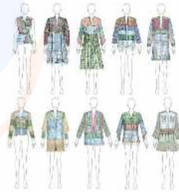
Gambar 5. Developing

Dengan memanfaatkan jaring ikan tidak terpakai dan sisa kain perca, sustainable fashion yang peneliti ingin hadirkan akan terlihat lebih jelas, ditambah penggunaan teknik menganyam pada jaring yang akan menambah nilai estetika pada pakaian.