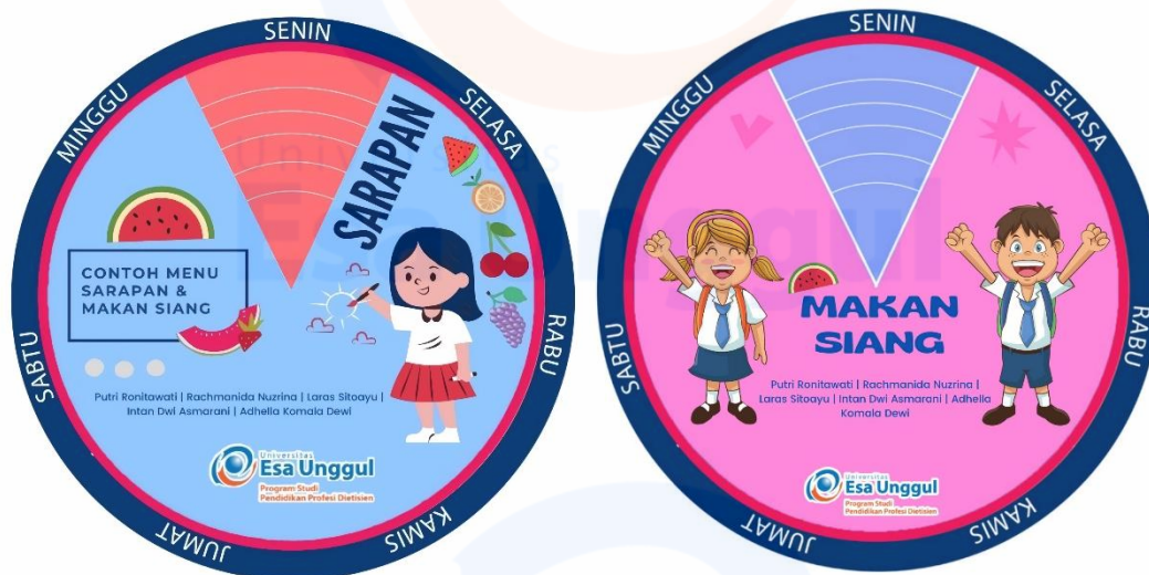
Gambar 3. Pembagian cakram gizi contoh menu makan pagi dan siang

berkonsentrasi. Dengan mengonsumsi sarapan dapat meningkatkan kemampuan anak untuk belajar. Makanan yang harus dikonsumsi sewaktu sarapan sebetulnya tidak perlu yang khusus, tetapi justru merupakan bagian dari menu diet seimbang (Titis, 2015).