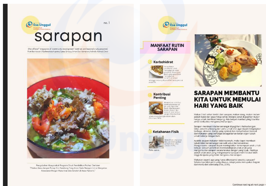
Gambar 2. Pembagian majalah kepada peserta

jumlah dan jenis zat gizi yang masuk ke tubuh berkurang. Hal-hal yang perlu dilakukan untuk mencegah penyakit infeksi salah satu hal yang penting ialah mencuci tangan dengan 6 langkah menggunakan sabun dan air bersih mengalir sebelum makan, sebelum menyiapkan makanan dan minuman, dan setelah buang air besar dan kecil, sehingga hal ini akan menghindarkan terkontaminasinya tangan dan makanan dari kuman penyakit antara lain kuman penyakit typhus dan disentri. Menutup makanan yang disajikan akan menghindari makanan dihinggapi lalat dan binatang lainnya serta debu yang membawa penyakit, selalu menggunakan alas kaki agar terhindar dari penyakit kecacingan juga merupakan hal penting untuk mencegah penyakit infeksi. (3) melakukan aktivitas fisik yang meliputi berbagai macam kegiatan tubuh termasuk olahraga untuk menyeimbangkan antara pengeluaran dan pemasukan zat gizi utamanya sumber energi didalam tubuh. Aktivitas fisik berperan penting dalam menyeimbangkan zat gizi yang keluar dan masuk kedalam tubuh, dengan aktivitas fisik bisa memperlancar sistem metabolisme zat gizi. (4) memantau berat badan secara teratur untuk mempertahankan berat badan yang optimal. Pemantauan BB normal merupakan hal yang harus menjadi bagian dari “Pola Hidup’ dengan ‘Gizi Seimbang’ sehingga dapat mencegah penyimpangan berat badan normal.