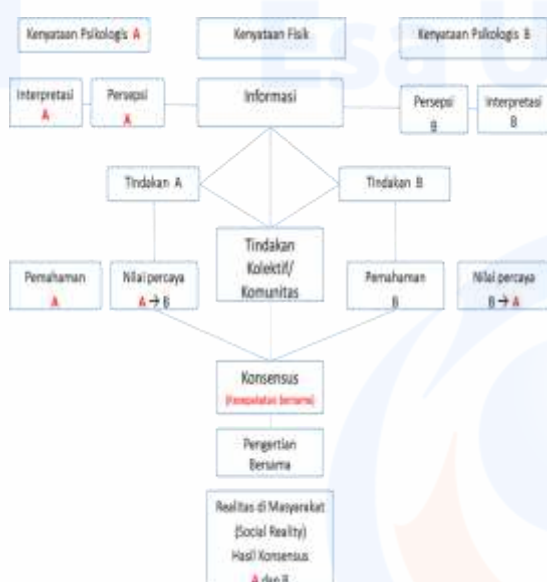
Gambar. 2. Model komunikasi konvergen (Roger & Kincaid, 1981)

Model komunikasi konvergen ini memberikan kesamaan persepsi terhadap ketahanan pengasuhan anak remaja Cerebral Palsy melalui konsensus dan pengertian bersama yang menghasilkan tindakan kolektif dari pertukaran informasi yang diterima dari anggota keluarga dan orang tua dengan pihak-pihak terkait seperti Pemerintah, rehab medik, komunitas serta lingkungan sekitarnya,