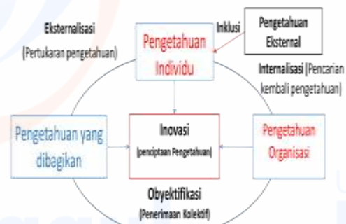
Gambar. 3. Siklus Sharing pengetahuan keluarga Cerebral Palsy (Soemardjo, 2010)

Berdasarkan perbedaan pemahaman dan nilai percaya inilah makanya terjadi sebuah konsensus (kesepakatan bersama) dalam ketahanan pengasuhan anak remaja Cerebral Palsy . Dengan demikian realitas dimasyarakat juga berubah diakibatkan dengan proaktif dalam berbagi pengetahuan ( Sharing Knowledge ),