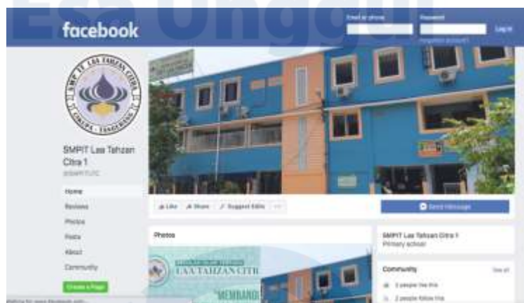
Gambar 2. Akun Facebook SMPIT Laa Tahzan Citra

membagikan foto, video dan chatting . Facebook video juga dapat digunakan untuk live streaming seperti webinar atau pembelajaran secara sinkron. Penggunaan Facebook dapat dijadikan pilihan guru dalam pembelajaran campuran. Menurut penelitian oleh Sibuea et al. (2020) penggunaan Facebook untuk pembelajaran daring cukup efektif dan adanya hasil belajar yang meningkat setelah penggunaan Facebook untuk pembelajaran.