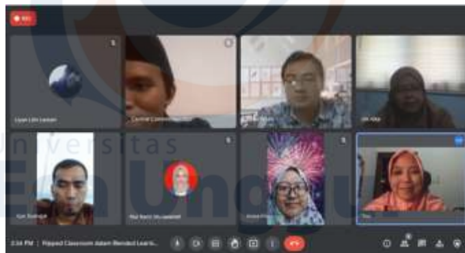
Gambar 5. Pelatihan penerapan flipped classroom dalam pembelajaran campuran

Dalam mempersiapkan pembelajaran campuran ( hybrid ), selain dilatih mengenai penggunaan media pembelajaran melalui media sosial, guru-guru juga dilatih mengenai penerapan metode yang tepat untuk pembelajaran campuran yaitu dengan flipped classroom . Menurut Bergmann & Sams (2012) flipped classroom merupakan metode pembelajaran yang inovatif dan berpusat pada anak dengan membalik strategi pembelajaran yang dilakukan. Dalam pembelajaran campuran ( hybrid ), kegiatan belajar yang biasanya dilakukan di rumah dibalik menjadi kegiatan dilakukan di sekolah. Beberapa praktik baik penerapan flipped classroom telah dilakukan dalam berbagai mata pelajaran dan berbagai tingkat pendidikan. Salah satunya adalah penerapan flipped classroom dengan bantuan Google Classroom dalam pembelajaran matematika SMP yang dilakukan oleh Kurniawati et al. (2019) yang mengungkapkan bahwa proses pembelajaran flipped classroom berjalan baik dengan hasil belajar yang cukup baik dan antusiasme yang tinggi dari para siswa. Dalam sesi pelatihan ini, guru dikenalkan dengan konsep flipped classroom , langkah-langkah dalam pelaksanaannya serta penerapannya dalam pembelajaran.