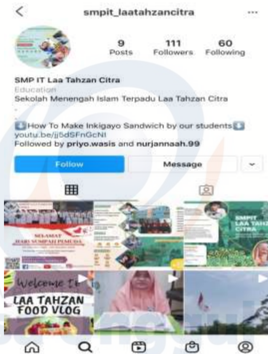
Gambar 4. Akun Instagram SMPIT Laa Tahzan Citra

Media sosial lain yang dapat digunakan untuk pembelajaran adalah Instagram. Instagram lebih baik diakses dari telepon pintar yang kebanyakan dimiliki oleh siswa. Sama halnya dengan Facebook, Instagram ini digunakan untuk interaksi sosial. Melalui Instagram, guru dan siswa dapat mengunggah foto, video pendek, video panjang di IGTV, mengunggah video cerita di Instagram Story, bahkan bisa juga melakukan siaran langsung di Instagram Live. Menurut Veygid et al. (2021) dalam pelaksanaan pembelajaran Biologi, Instagram sangat mudah digunakan dalam pembelajaran online terutama berinteraksi antara guru dan siswa karena aplikasi ini sangat familiar di kalangan remaja. SMP IT Laa tahzan Citra telah memiliki akun Instagram tetapi pemanfaatan untuk kegiatan pembelajaran belum maksimal. Pada sesi ini, para guru belajar bagaimana membagikan materi dan memberikan asesmen melalui Instagram.