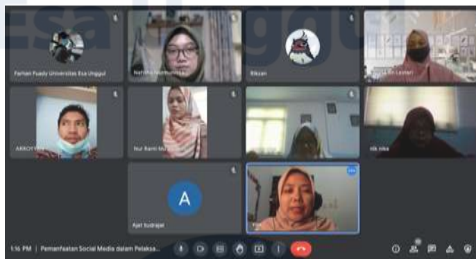
Gambar 1. Pelatihan pemanfaatan media sosial untuk pembelajaran

Guru-guru diperkenalkan ke berbagai jenis media sosial yang dapat digunakan untuk pembelajaran. Media sosial yang dibahas adalah yang paling populer saat ini berdasarkan data penggunaan media sosial terbanyak sampai bulan Juli 2021 dari Datareportal yang dilaporkan oleh Kemp (2021) yaitu Facebook, YouTube, WhatsApp, dan Instagram.