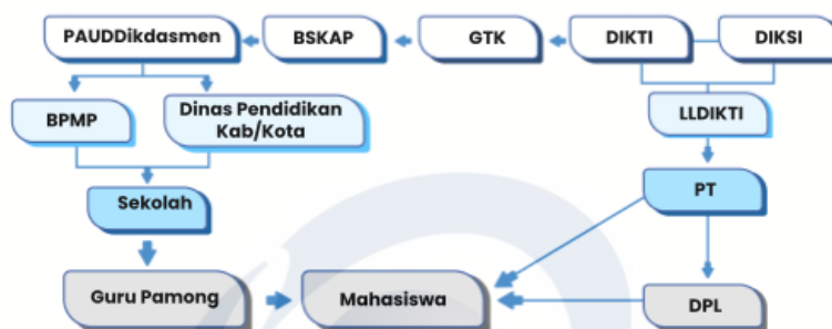
Gambar 2. Desain Program Kampus Mengajar Angkatan 5

Pada penelitian ini, evaluasi input difokuskan pada tiga parameter yaitu: Desain program Kampus Mengajar, Strategi rekrutmen mahasiswa, dan Rencana kerja mahasiswa. Desain Program Kampus Mengajar telah mempertimbangkan dengan baik beberapa hal seperti pelaksanaan program dan hal-hal yang harus dilakukan oleh pihak terkait, Rekrutmen peserta yang menjelaskan tentang persyaratan, pendaftaran dan seleksi peserta, Tahapan pelaksanaan Program (pra penugasan, penugasan, dan pasca penugasan) dan Kurikulum Program.