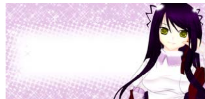
Gambar 5 Amplop (depan)