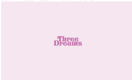
Gambar 9 Halaman pembuka