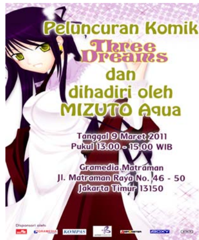
Gambar 20 Flyer