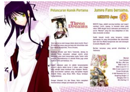
Gambar 19 Brosur (belakang)