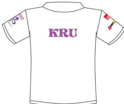
Gambar 28 Kaos Panitia (belakang)