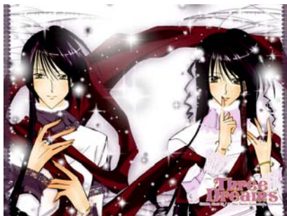
Gambar 17 Mini Poster