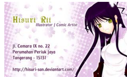
Gambar 15 Halaman Kontak