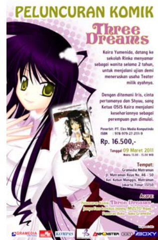
Gambar 25 Iklan Koran