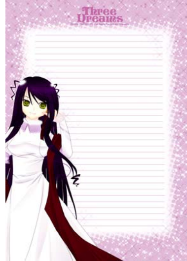
Gambar 4 Kertas Surat