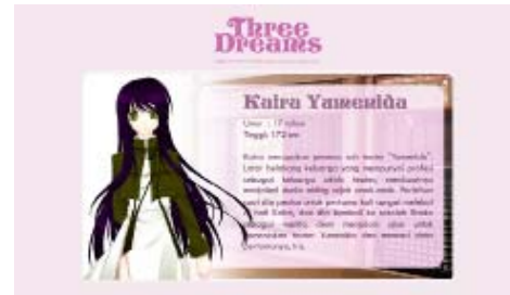
Gambar 13 Halaman Turunan Karakter