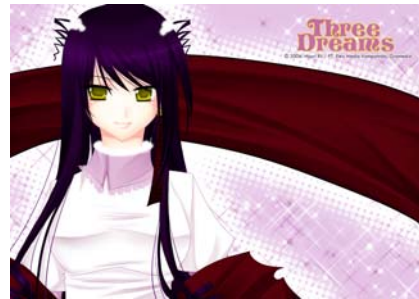
Gambar 31 Postcard (depan)