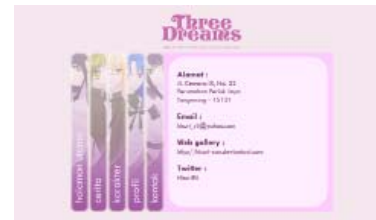
Gambar 14 Halaman Profil