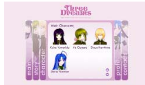
Gambar 12 Halaman Karakter