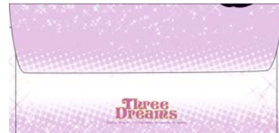
Gambar 6 Amplop (belakang)