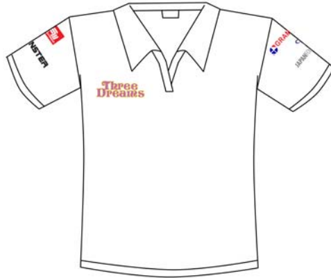
Gambar 27 Kaos Panitia (depan)