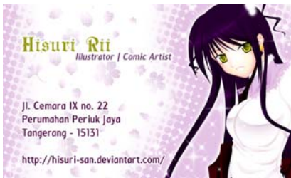
Gambar 2 Kartu Nama (depan)