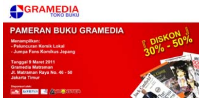
Gambar 23 Billboard