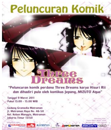
Gambar 16 Poster Event