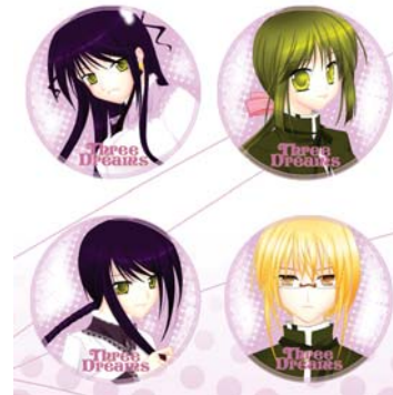
Gambar 26 Pin