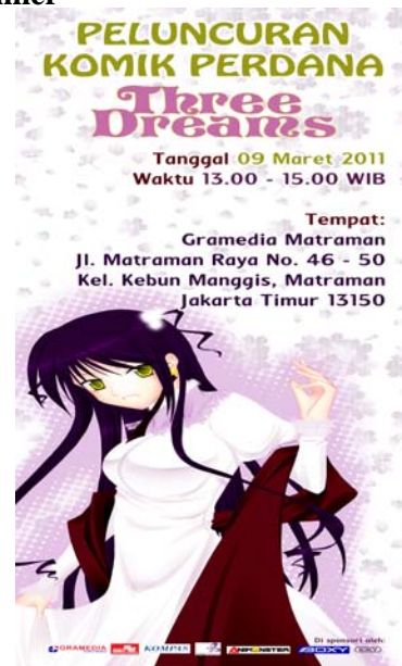
Gambar 21 X Banner