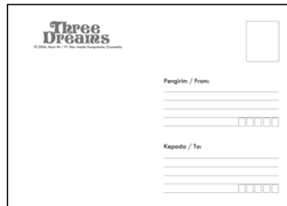
Gambar 32 Postcard (belakang)