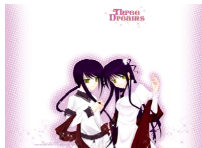
Gambar 7 Map (depan)