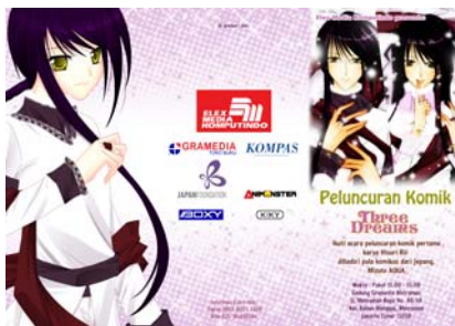
Gambar 18 Brosur (depan)