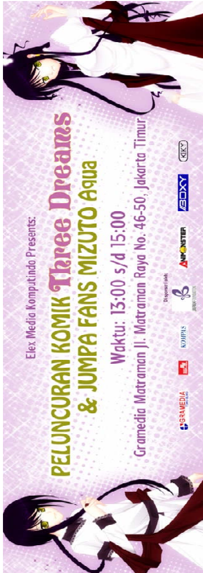
Gambar 22 Spanduk