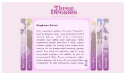
Gambar 11 Halaman Cerita