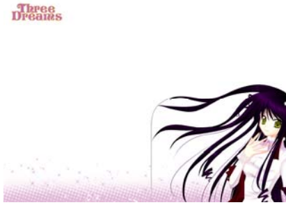
Gambar 8 Map (belakang)