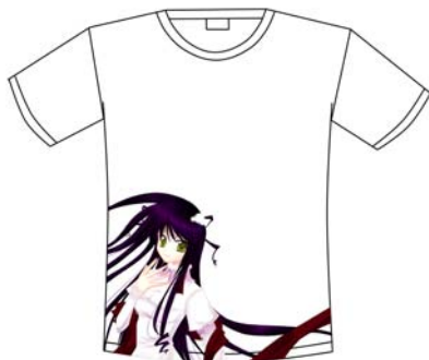
Gambar 29 Kaos Penggemar (depan)