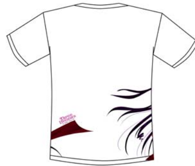
Gambar 30 Kaos Penggemar (belakang)