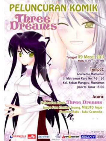
Gambar 24 Iklan Majalah