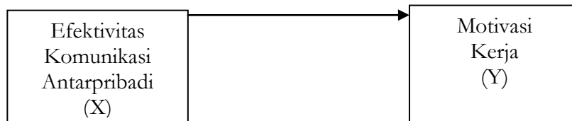
Gambar 1 Kerangka pemikiran penelitian

Oleh karena itu, dapat diduga bahwa efektivitas komunikasi antar pribadi memiliki hubungan dengan motivasi kerja karyawan pada perusahaan, yang dapat diilustrasikan dalam Kerangka Pikir berikut ini: