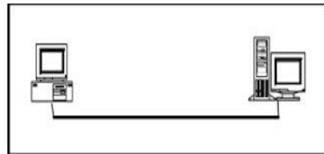
Gambar 2 Referensi Cisco Netacad.com

Jaringan telah mengubah cara belajar. Jaringan yang kuat dan dapat diandalkan mendukung dan memperkaya pengalaman belajar siswa. Penyampaian materi pembelajaran dalam berbagai format termasuk kegiatan interaktif, penilaian, dan umpan balik. Seperti ditunjukkan dalam Gambar 2.