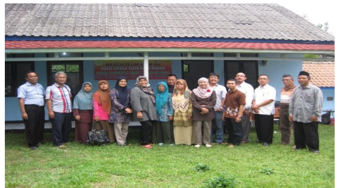
Gambar 3. Para instruktur pengabdian masyarakat.

Pelaksanaan kegiatan pengabdian bukan berarti tanpa hambatan. Selama pelaksanaan ada beberapa hal yang diidentifikasi sebagai faktor penghambat kegiatan pengabdian diantaranya Rendahnya kemampuan dasar sebagian peserta pelatihan tentang Ilmu jaringan komputer. Selama ini peserta hanya sebagai user atau operator juga perangkat alat-alat peraga yang masih terbatas untuk alat utama jaringan dan jumlah perlengkapan pendukung yang jumlahnya tidak sesuai dengan peserta yang berakibat penggunaan peralatan secara bergantian. Untuk meminimalisasi faktor hambatan ini, sebaiknya pelatihan ini dapat dilakukan lagi, sehingga pemerataan pengetahuan akan tersebar.