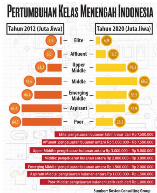
Gambar. Pertumbuhan Kelas Menengah Indonesia

Dalam membidik pasar, Target klinik Kamala memilih golongan kelas masyarakat dengan pengeluaran bulanan antara Rp. 5,000,000 - Rp. 7,000,000.- (Affluent) dan lebih besar dari Rp. 7,000,000.- (Elite) golongan tersebut berada pada level upper middle. dapat dilihat pada gambar berikut :