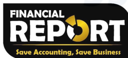
Gambar 1. 2 Logo Perusahaan

Logo pada Financial Report Assistant (FIRA) berwarna hitam dan emas. Warna hitam bermakna kerahasiaan yang berarti Financial Report adalah mitra yang mampu dipercaya untuk menjaga rahasia keuangan customer . Sedangkan warna emas melambangkan kemakmuran yang artinya dengan menggunakan layanan Financial Report Assistant (FIRA) akan mampu meningkatkan bisnis perusahaan yang berkelanjutan. Accounting solution memberikan makna Financial Report Assistant (FIRA) sebagai solusi permasalahan pelaporan akuntansi dan pengambil keputusan oleh customer .