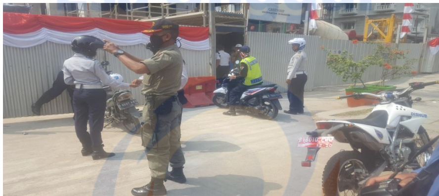
Mengikuti Tertib Trotoar