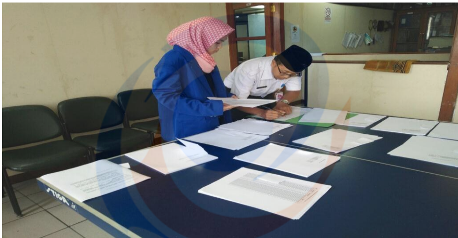
Melayani Pembagian Akun Citizen Relations Management (CRM)