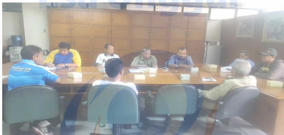
Mengikuti Silaturahmi Bersama Suku Dinas dan Wartawan