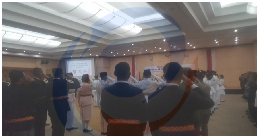
Mengikuti Upacara Pengukuhan Pasukan Pengibar Bendera Pusaka