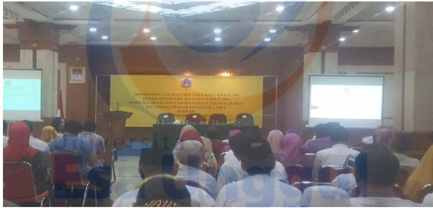
Mengikuti Rapat Monitoring Validasi KIB A dan KIB C