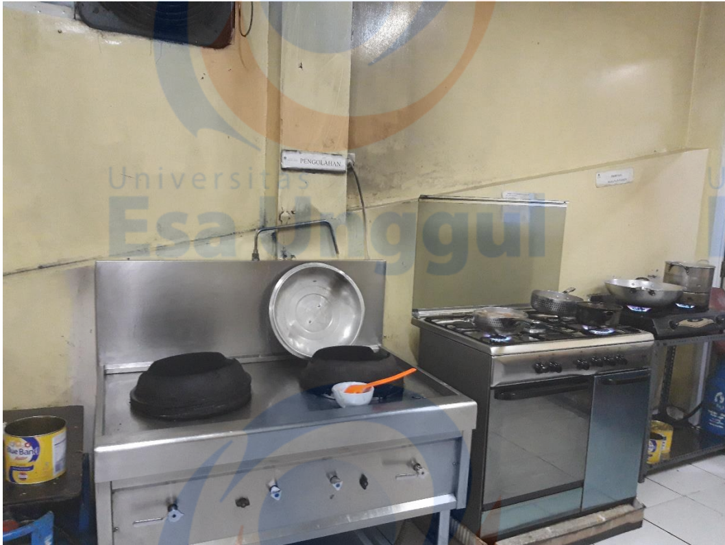
Dapur di Unit Gizi