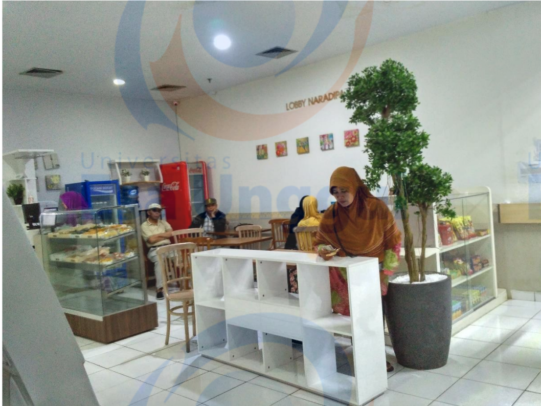
Kantin di Lantai Basement