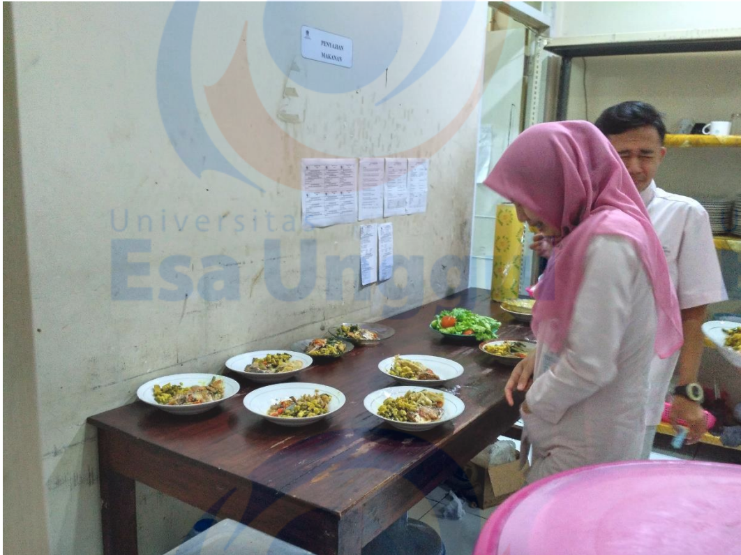
Tempat Penyajian Makan Karyawan