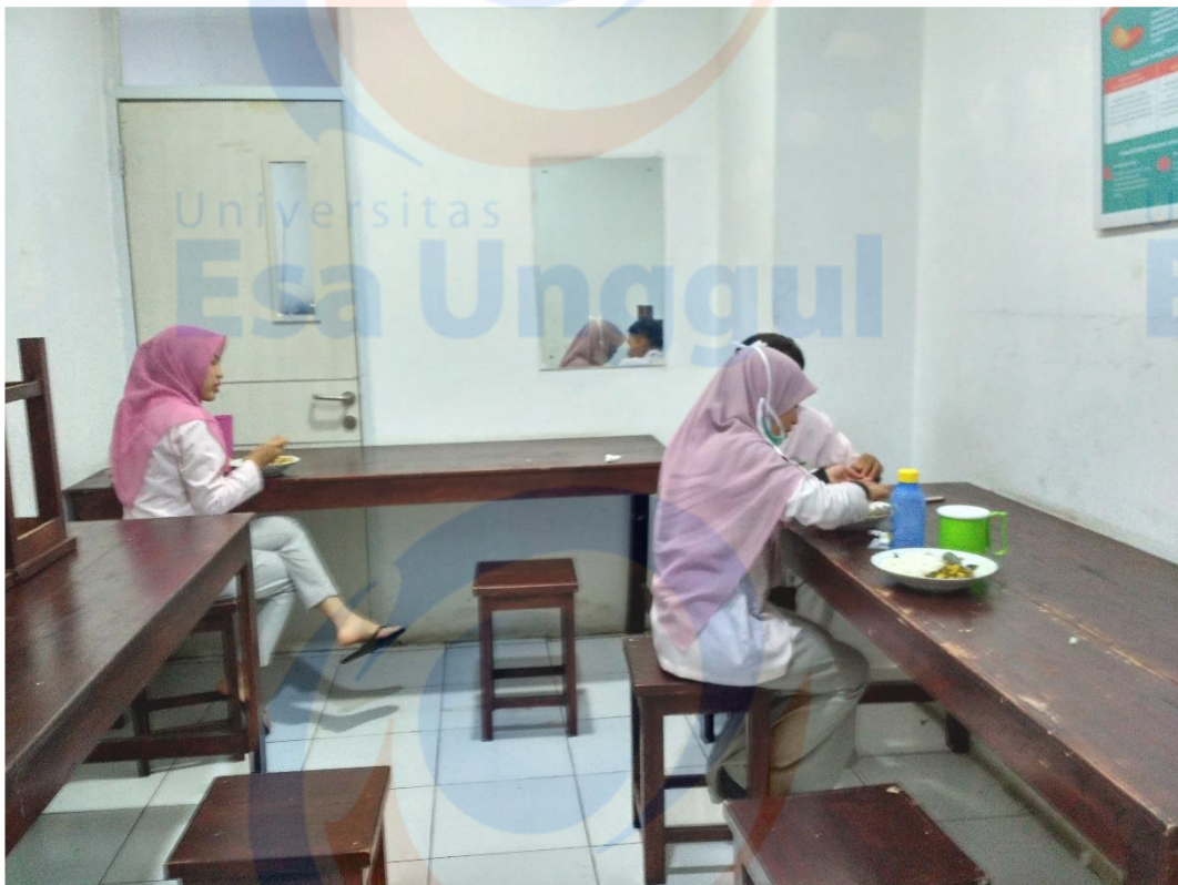
Ruang Makan Karyawan