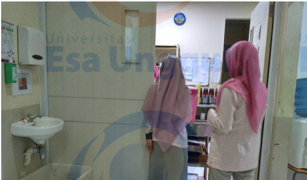
Pintu Masuk Tempat Pengambilan Makan