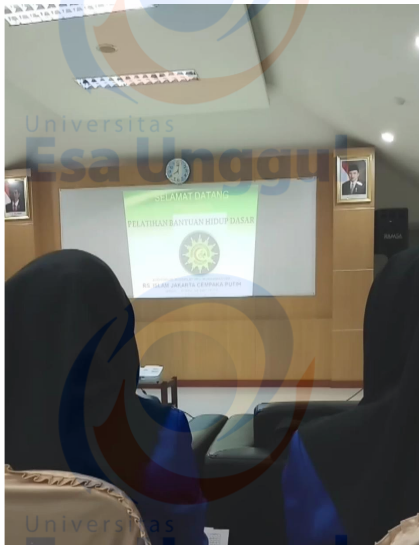
Foto saat melaksanakan pelatihan