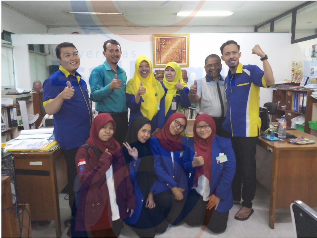
Foto Bersama Pembimbingan Lapangan Dan Staff SDI (Sumber Daya Insani) Rumah Sakit Islam Jakarta Cempaka Putih