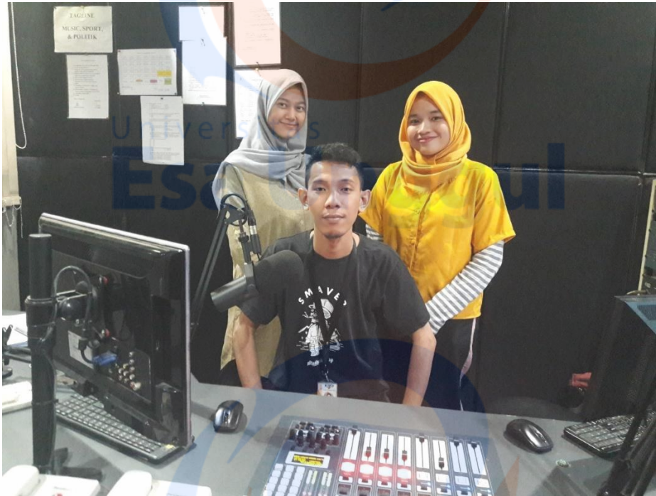
Foto bersama produser dan media relations radio 104.2 MSTRI FM