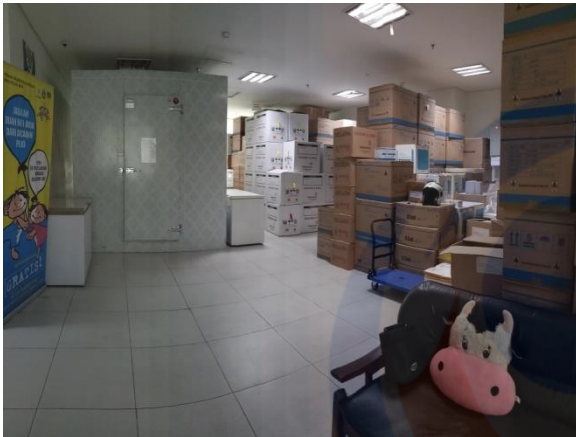
Gambar VII. Cold Room 1