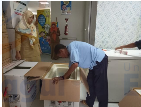
Gambar IV. Kegiatan Distribusi Skala Besar