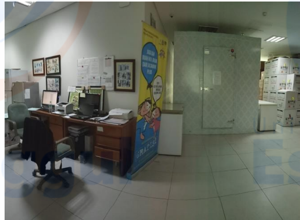
Gambar IX. Meja Kerja