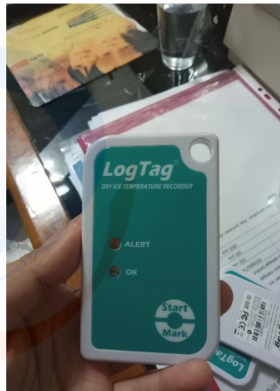
Gambar V. Freeze Tag