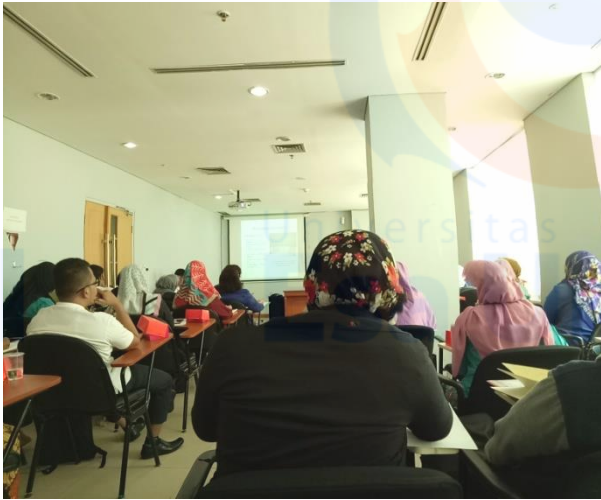
Gambar XI. Forum Rapat Koordinasi Puskesmas Kec. dan Dinas Kesehatan tentang “Pengelolaan Vaksin dan Logistik Imunisasi”.