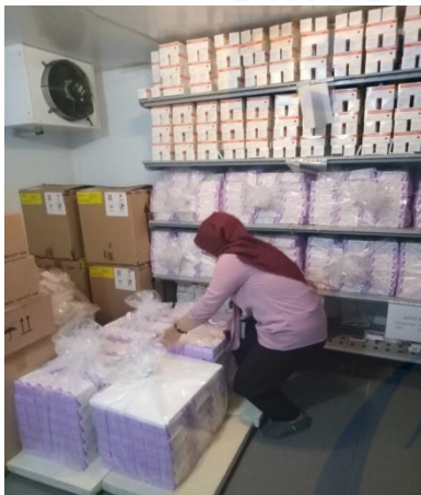
Gambar III. Kegiatan Memindahkan Vaksin ke Cold Room