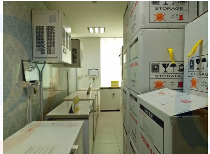
Gambar X. Freezer Vaksin dan Cold Pack.