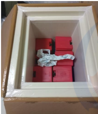
Gambar II. Gambaran Cold Pack didalam Kemasan Vaksin