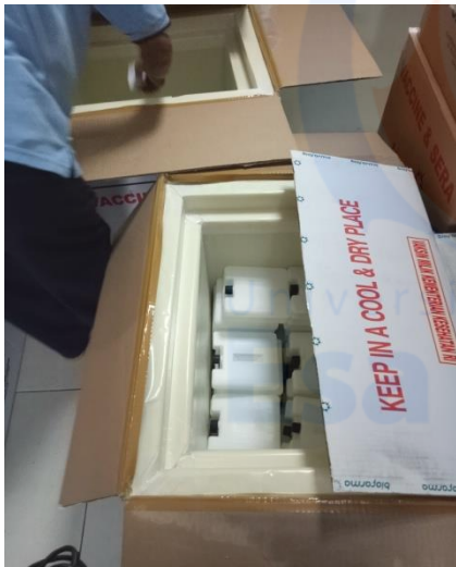
Gambar I. Gambaran Cool Pack didalam Kemasan Vaksin