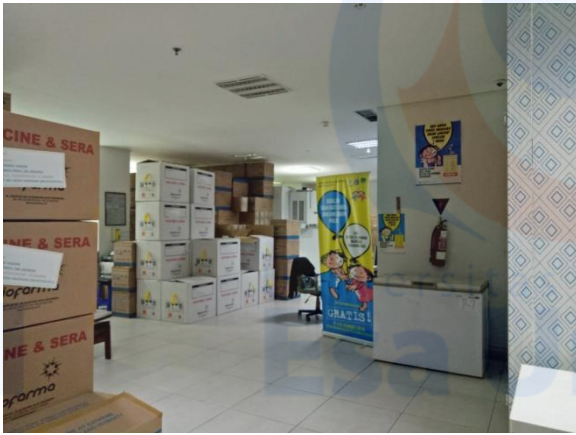
Gambar VI. Ruangan Kerja dan Penyimpanan dari Pintu Masuk