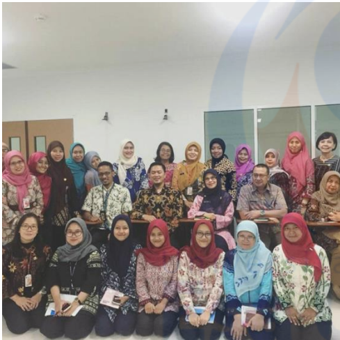
Gambar XII. Seminar “Forum Komunikasi Mutu Provinsi DKI Jakarta”.