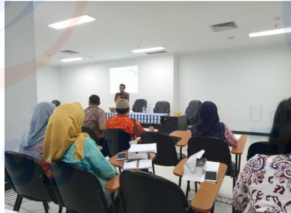
Gambar XIII. Seminar “Forum Komunikasi Mutu Provinsi DKI Jakarta”.