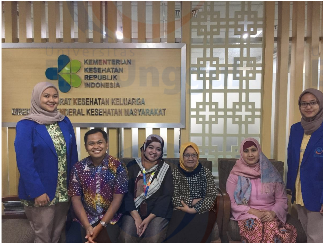
Foto Bersama Para Direktur