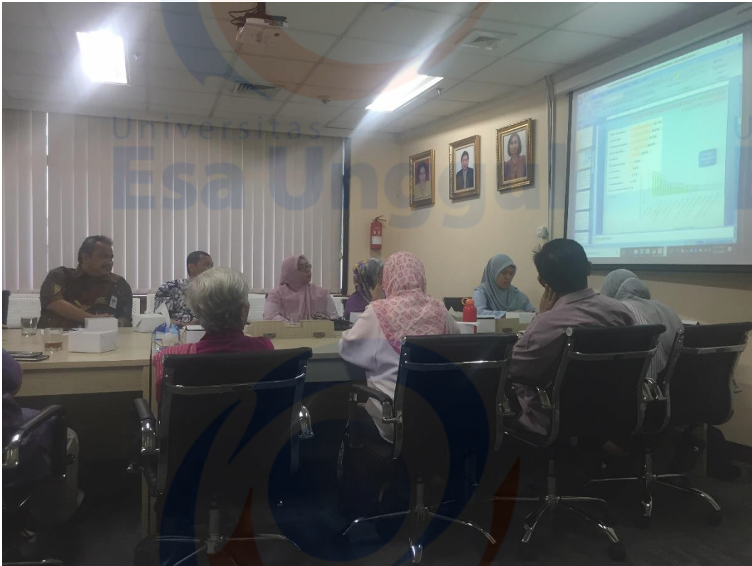
Foto Kegiatan Rapat Pertemuan