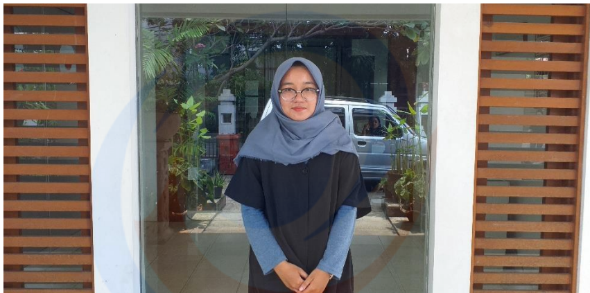
Gambar 1.2 foto di depan kantor Bella Donna Group Sumber: Leni Trihandayani, 1 April 2019, pukul 12:18 WIB

Sumber: https://www.google.com/maps/ , diunduh pada tanggal 7 Februari 2019, pukul 17.08 WIB