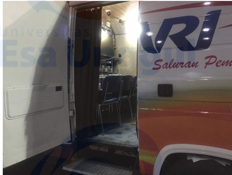
Foto 5.1 Ob Van

Keterangan : Persiapan Siaran Langsung melalui Transmisi OB Van.