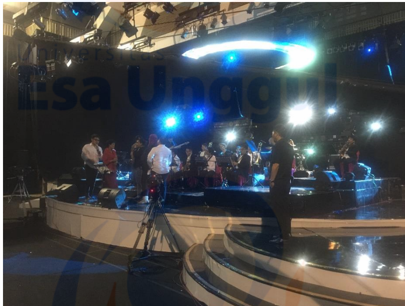
Foto 5.6 Klub Jazz

Keterangan : Persiapan sebelum acara dimulai