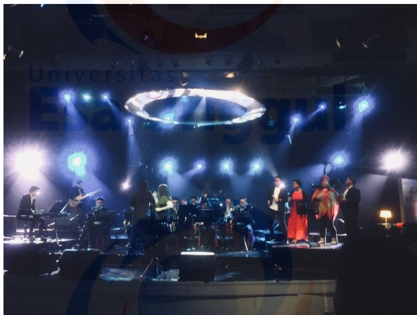
Foto 5.4 Acara Klub Jazz