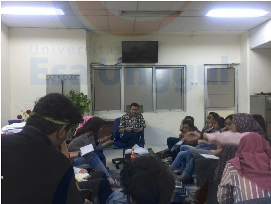
Foto 5.2 Meeting