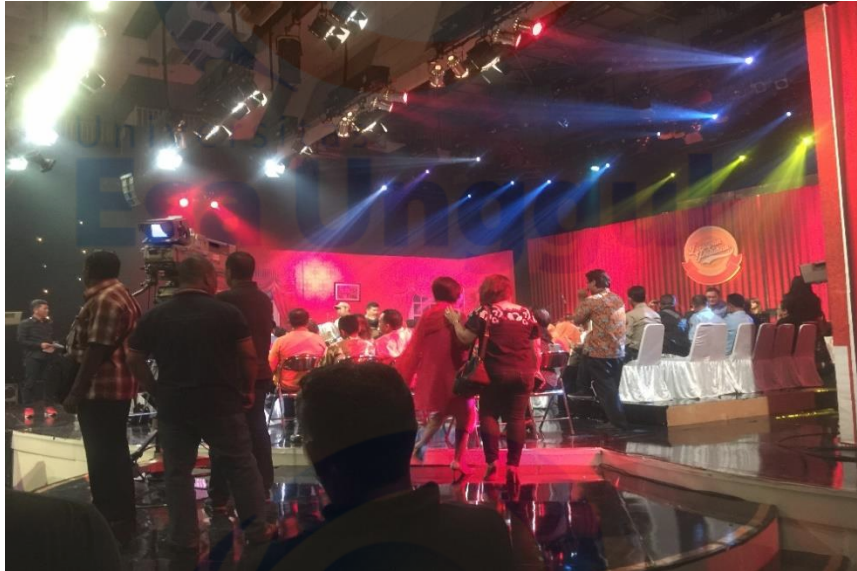
Foto 5.3 Produksi Acara Delapan Puluhan