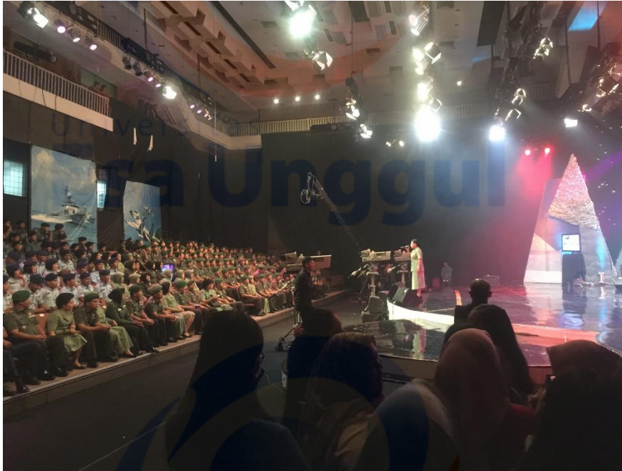
Foto 5.5 Acara Kamera Ria

Keterangan : Gladi resik para TNI Beserta Ibu Persit