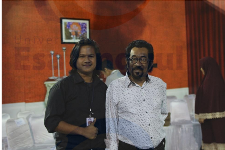
Foto 5.7 Foto Bersama Talent