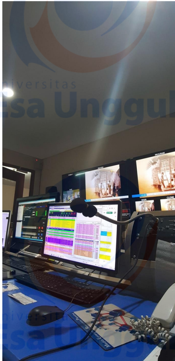
MEMANTAU PLAYLIST YANG SEDANG TAYANG