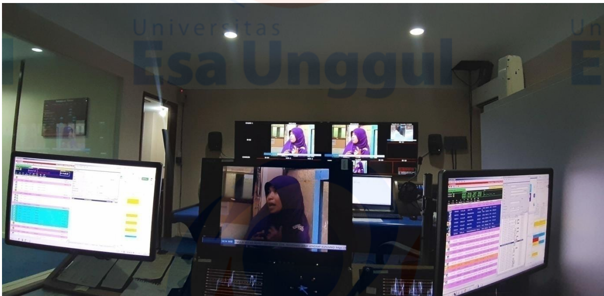
MENGAWASI DAN MENGECEK JALANNYA TAYANGAN YANG SEDANG BERLANGSUNG