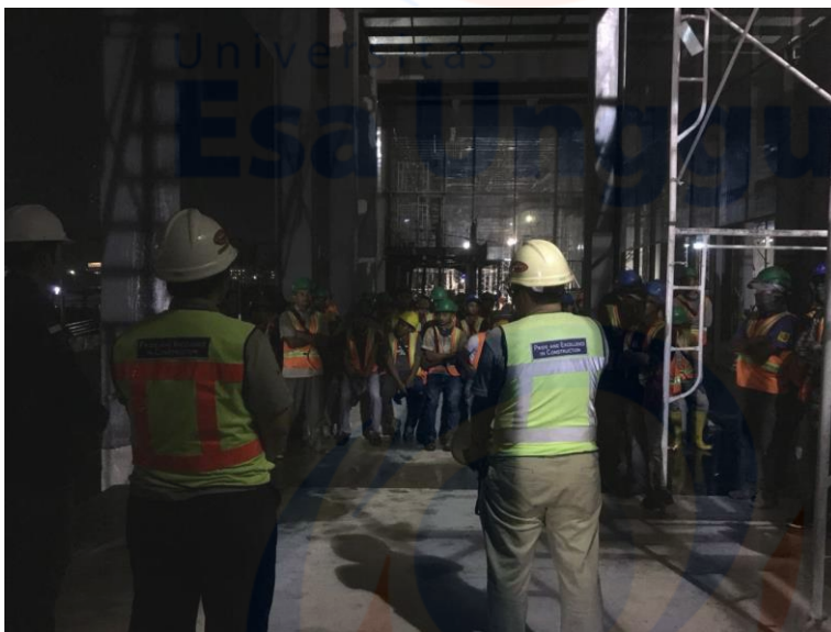
Pada saat kegiatan Program Toolbox Meeting di malam hari sebelum mulai bekerja.