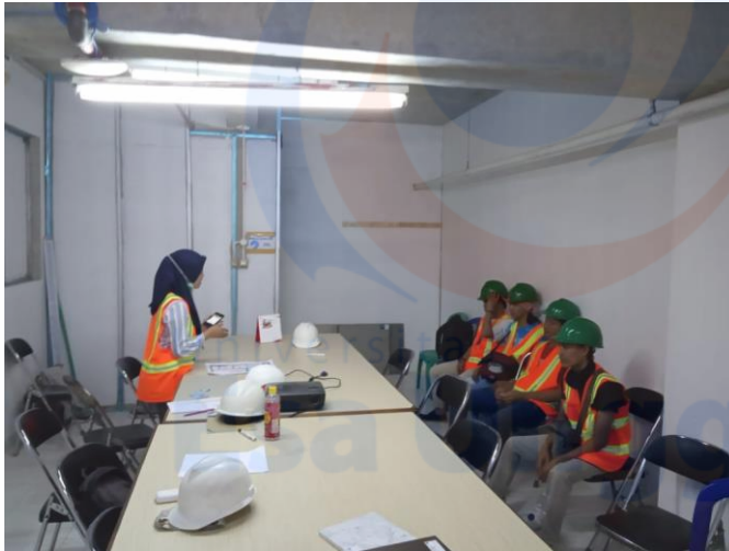
Pada saat melakukan kegiatan Safety Induction