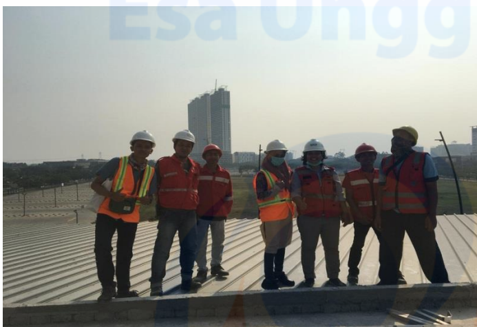
Pada saat sesi foto bersama HSE yang ada di Proyek Pembangunan Hotel Mercure BSD.