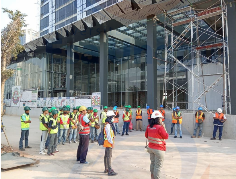
Pada saat kegiatan Program Toolbox Meeting di pagi hari sebelum mulai bekerja.