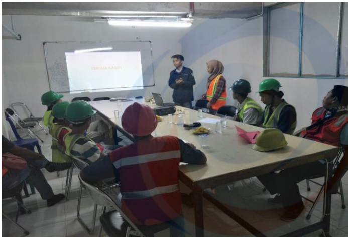
Pada saat melakukan kegiatan Penyuluhan Kesehatan pada pekerja.