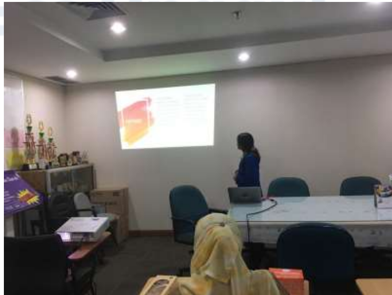
Lampiran XIII : Sumber Daya Manusia (SDM) Seksi Kesehatan Keluarga