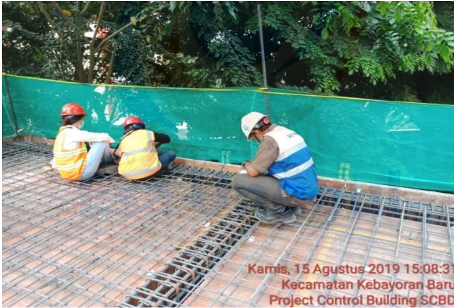
Kamis, 15 Agustus 2019 15:08:31 Kecamatan Kebayoran Baru Project Control Building SCBD