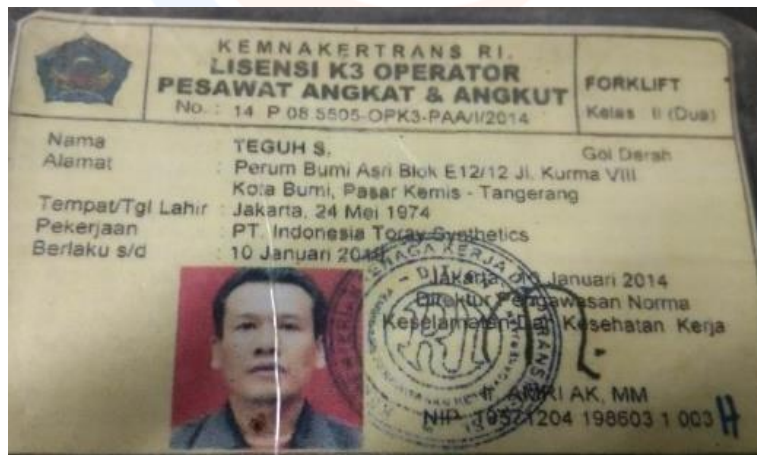
Lisensi k3 Operator Pesawat Angkat & Angkut