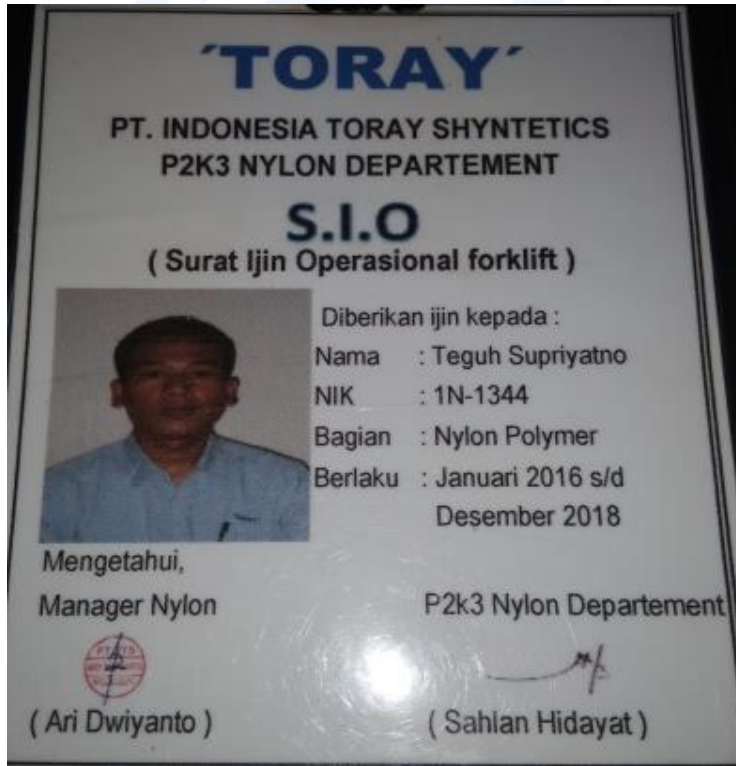
Surat Ijin Operasional Forklift PT Indonesia Toray Synthetics