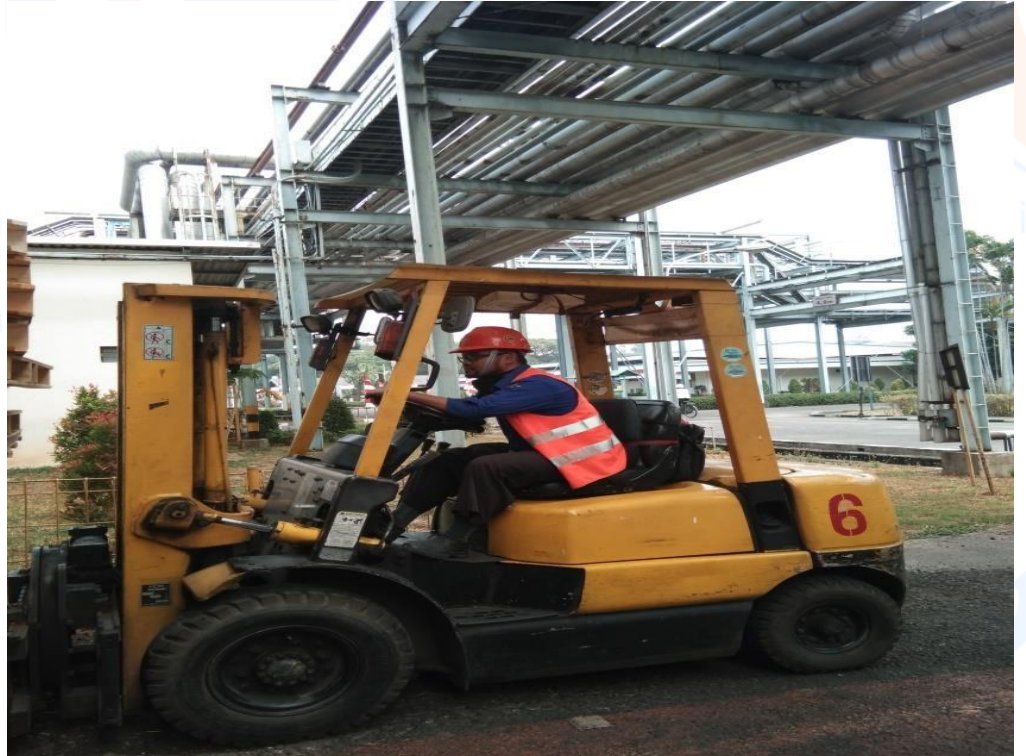
forklift yang berada di PT Indonesia Toray Synthetics (ITS)