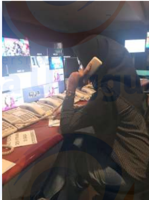
Proses Menghubungi Narasumber Dan Reporter