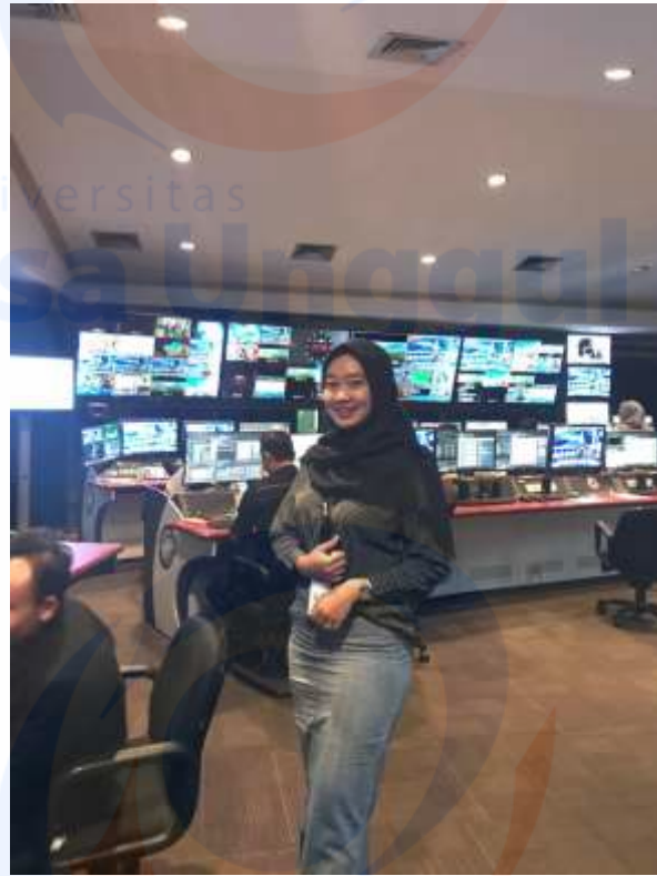
Suasana Main Control Room