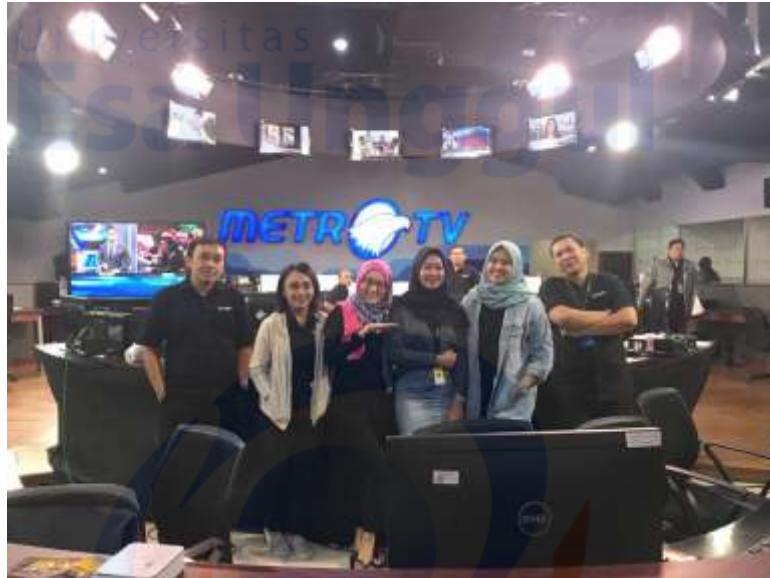
Suasana Bersama Tim Produser Di News Room