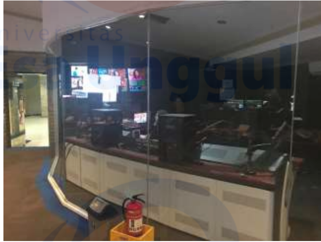
Suasana Ruang Audioman