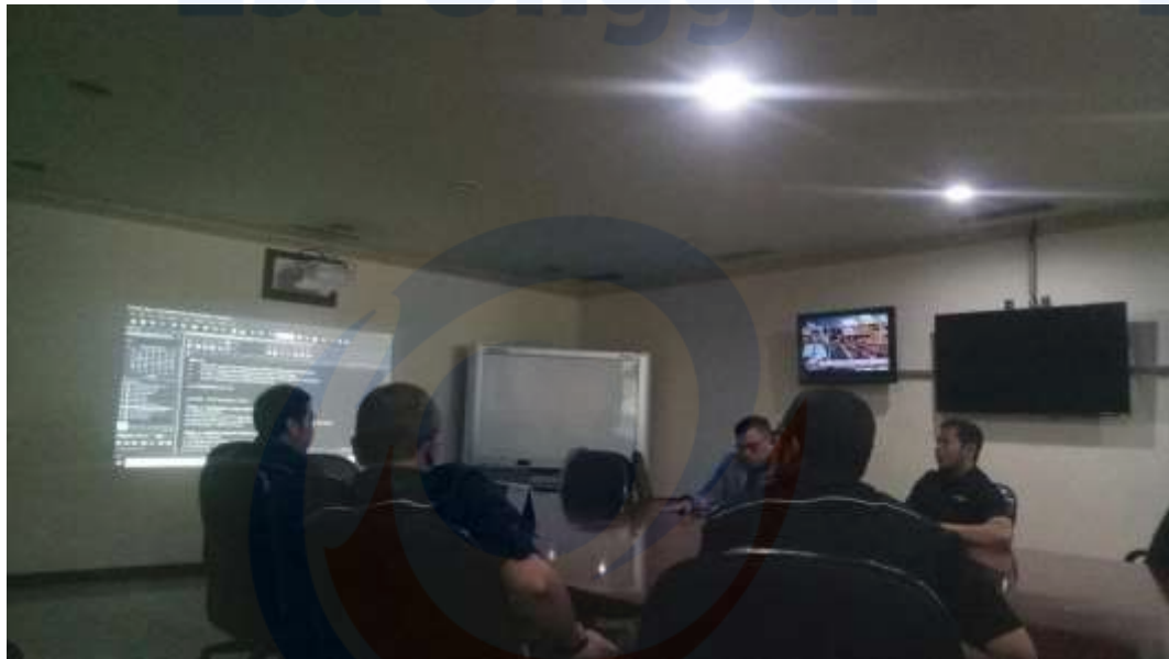
Suasana Rapat Tim Redaksi