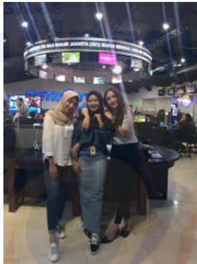
Suasana News Room Bersama Tim