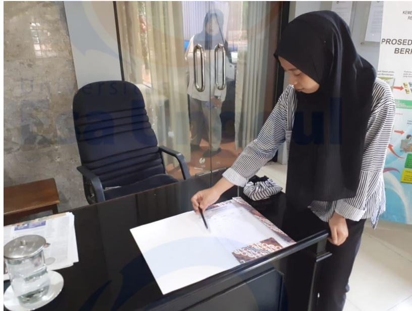
Foto Penulis Bersama Kepala Subbagian Biro Humas Kemhan RI