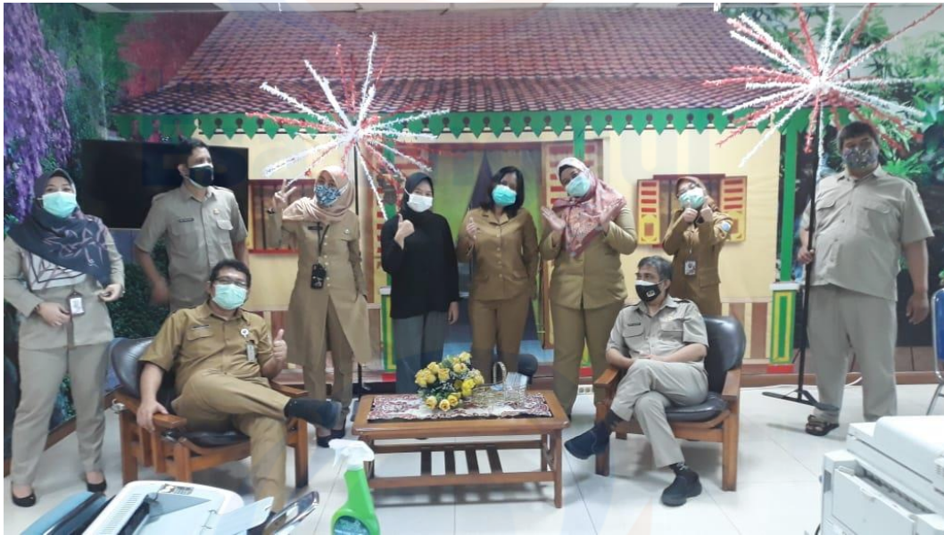
Foto Bersama Seksi Gizi, Promosi Kesehatan, dan Pembinaan Peran Serta Masyarakat Dinas Kesehatan Provinsi DKI Jakarta