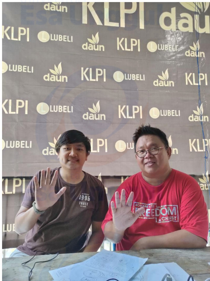
Gambar 5. (Foto bersama CEO PT. Kreasi Lima Pilar Indonesia)