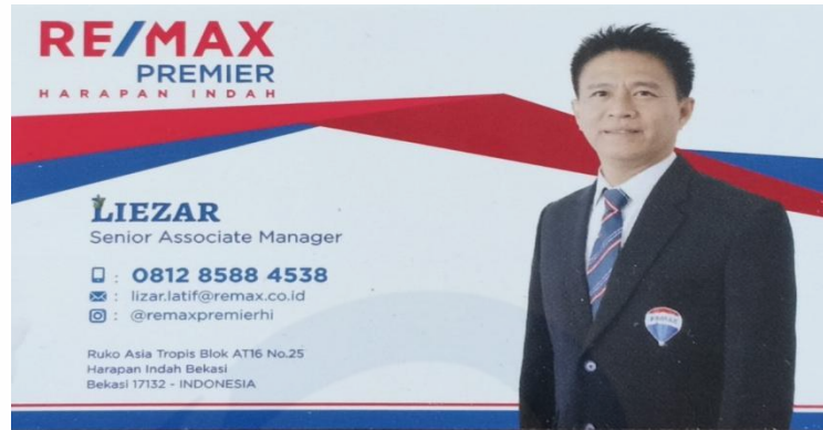
Gambar 11 – Nama agen di kartu nama nya