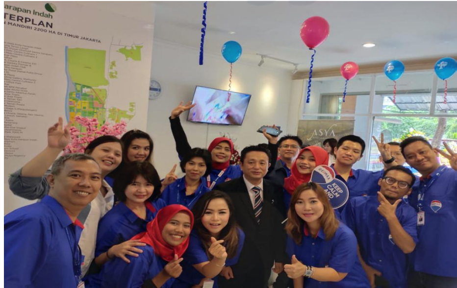
Gambar 9 – Foto bersama Agent PT. Re/max Harapan indah Bekasi