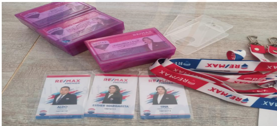
Gambar 14 – Kartu nama dan name tag yang akan dibagikan kepada para agen