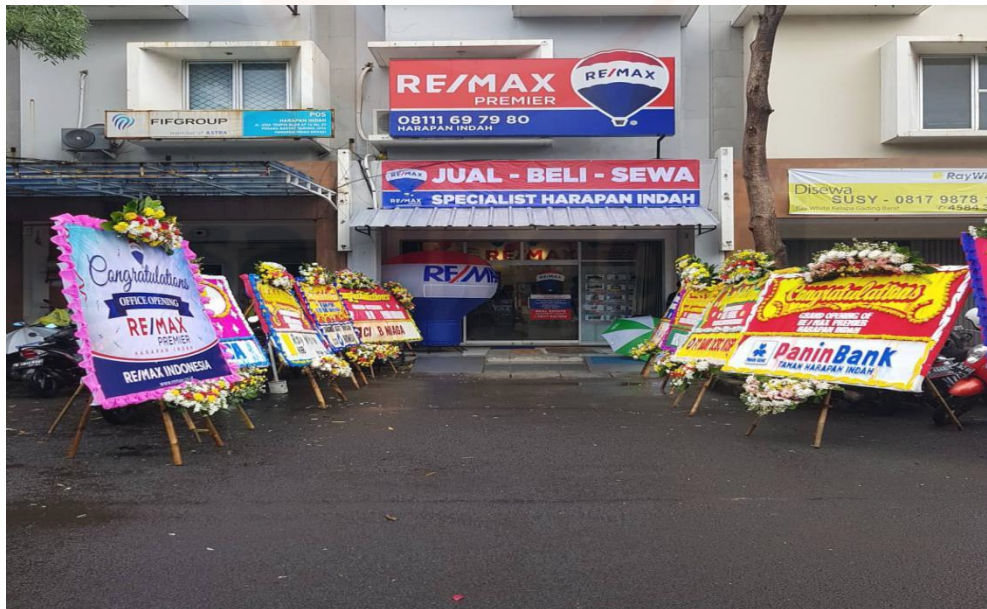
Gambar 10 - Foto Pembukaan Grand Opening PT Re/max Premier Harapan Indah Bekasi