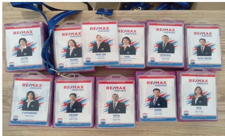
Gambar 12 – Kalung Name tag atau tanda pengenal para agen