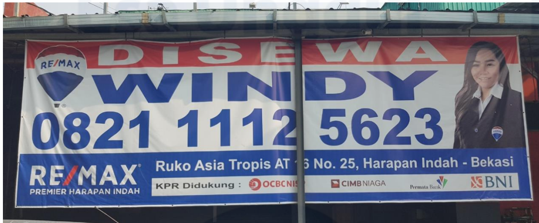
Gambar 13 – Spanduk agen yang menjual properti