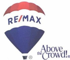
Gambar 16 – Surat Keterangan dari PT. Re/max Harapan Indah Bekasi

Office : Rukan Asia Tropis AT16 No. 25 Harapan Indah Bekasi Jawa Barat 17132 - INDONESIA Call Center : +62 8111-697980 premierhi.remax.co.id / www.premierhi.remax.co.id Each REMAX Office is independently Owned and Operated