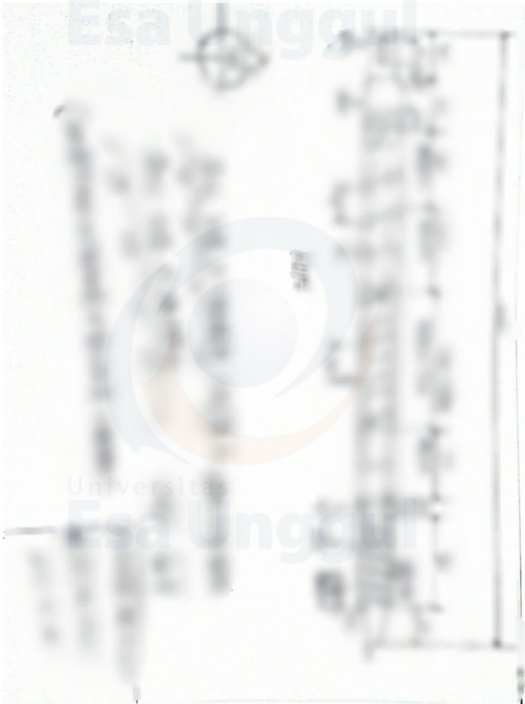
Lampiran 12. Desain Gambar Produk Screw dan Barrel