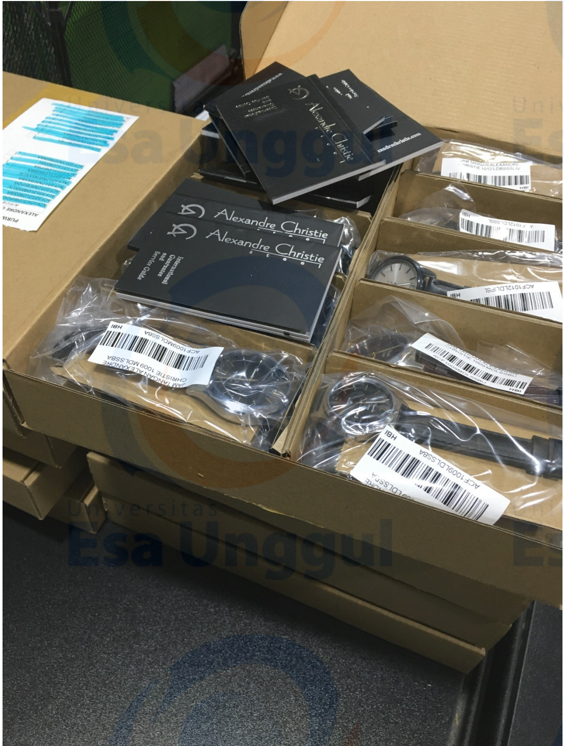
Lampiran 4 : Produk Jam Tangan