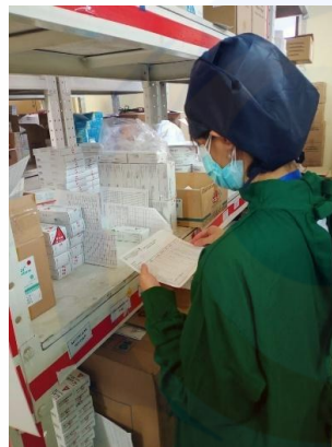
Pencatatan Kartu Stock di Gudang