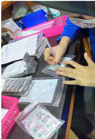
Pemberian Etiket untuk Pasien