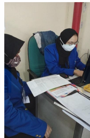
Penginputan Data Stock Opname