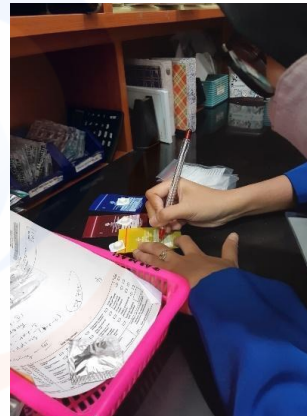
Penyiapan Etiket untuk Resep UDD