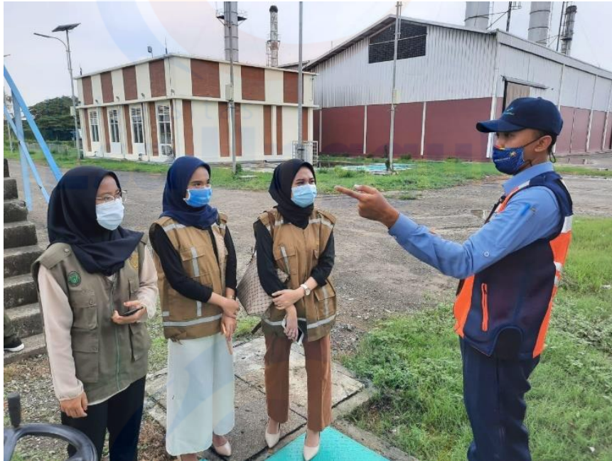
Briefing sebelum melakukan tinjauan terhadap IPAL bandara