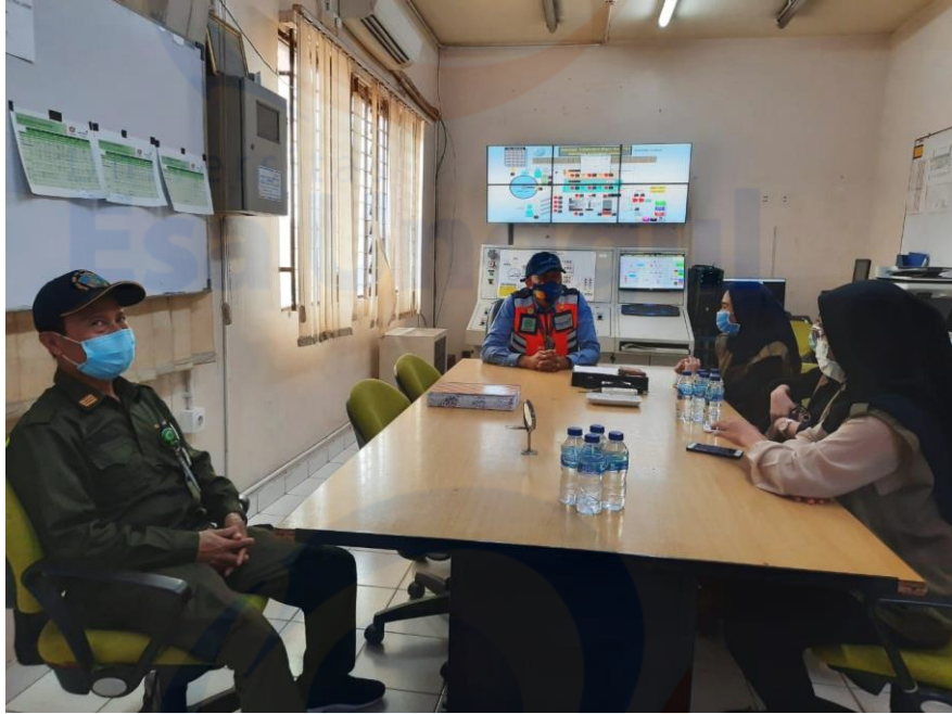
Evaluasi setelah melakukan tinjauan pada IPAL bandara