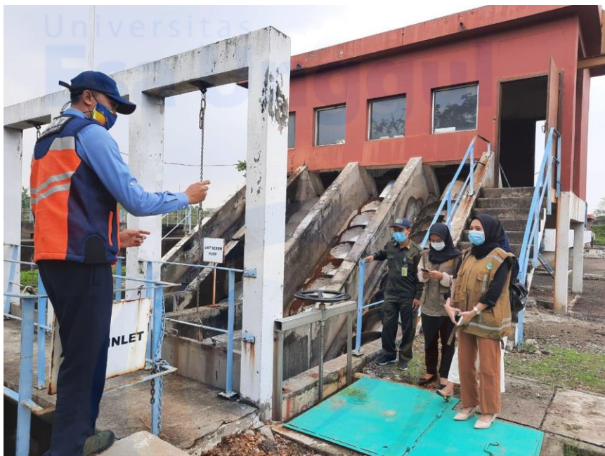
Penjelasan tentang pengolahan limbah di IPAL