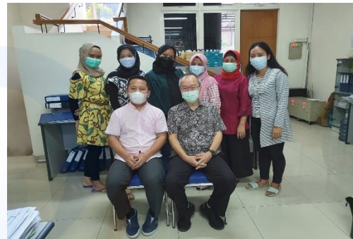
Gambar 5. Karyawan TJS