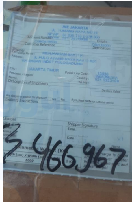
Gambar 2. Penerimaan Sampel