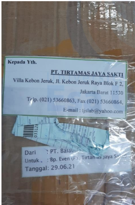
Gambar 1. Penerimaan sampel