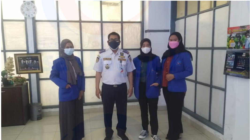
Lampiran 7 foto bersama kepala satuan pelaksana lalu lintas angkutan laut dan pelayanan jasa