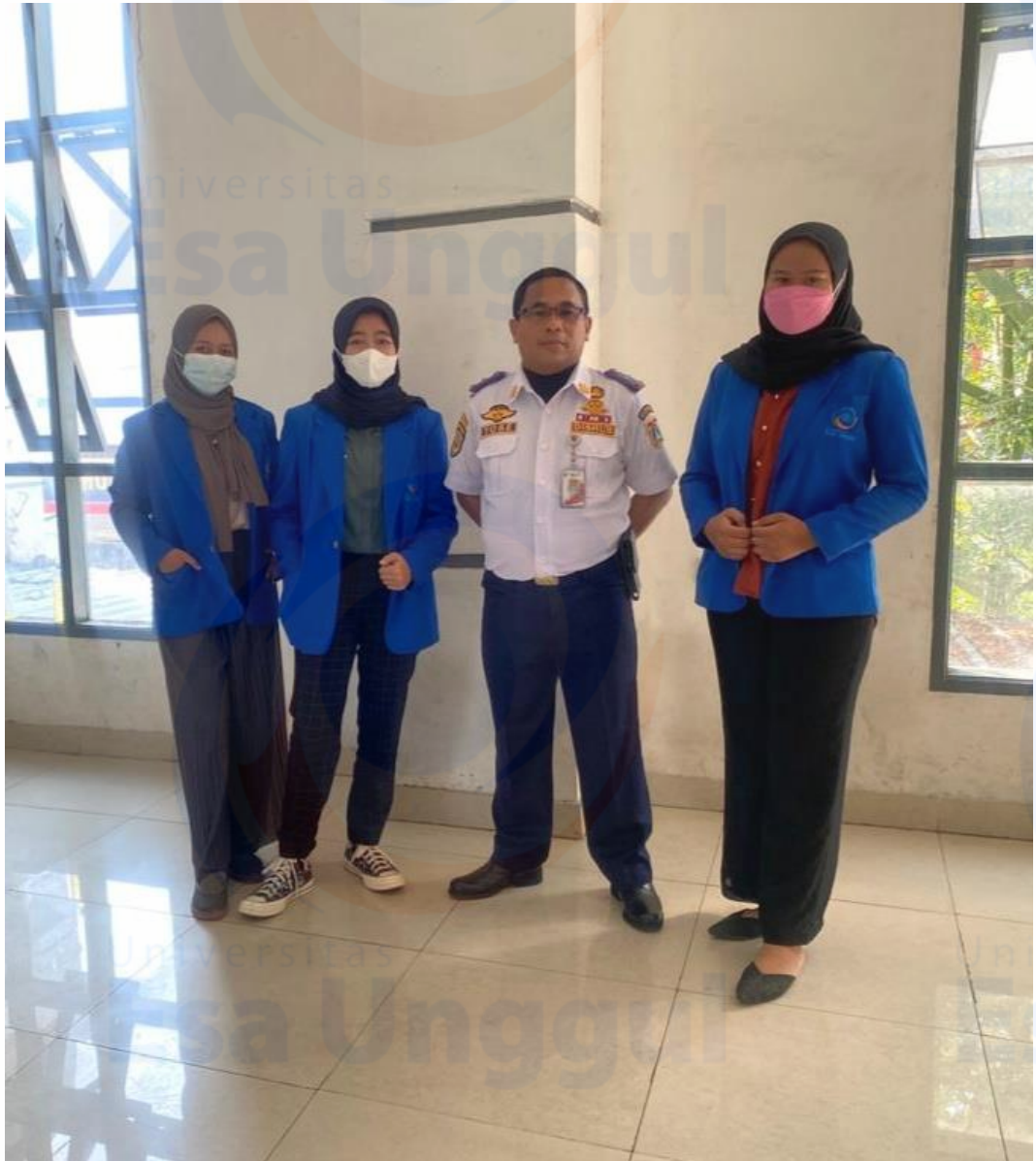
Lampiran 6 foto bersama Pembimbing Lapangan