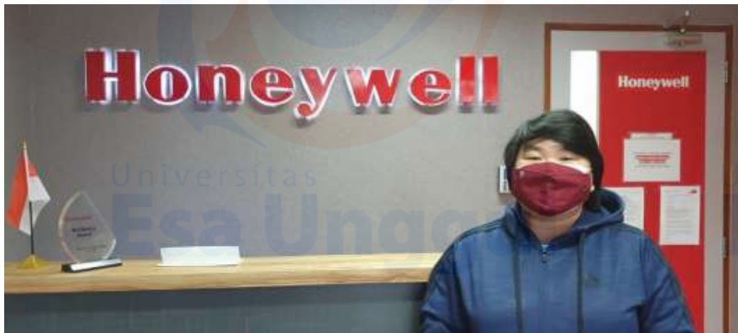
Lampiran 1.5 Foto diri pada perusahaan dan pada unit kerja