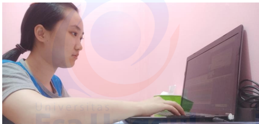
Lampiran 6 Dokumentasi Jam Kerja

Lampiran 5 Formulir Kehadiran Bimbingan Magang