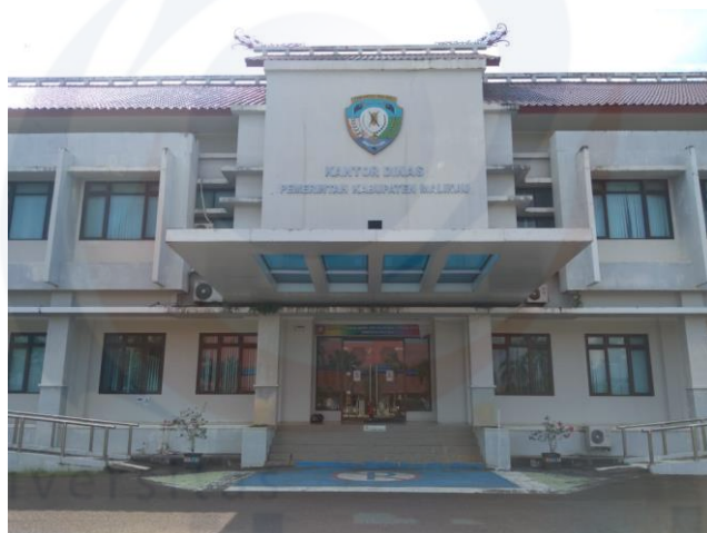
Gambar 1. 2 Kantor Dinas Penanaman Modal dan Pelayanan Terpadu Satu Pintu Kabupaten Malinau