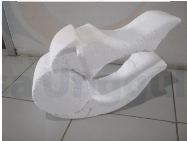
Gambar 3. Mockup Tron 1:3 Jakarta

Pada pembuatan mockup Rocking toy menggunakan bahan material styrofoam yang dibentuk dengan menggunakan amplas dan pemanas untuk memperhalus permukaannya. Mockup dibuat 1 : 3 kemudian finishing dengan di cat setelah seluruh permukaan mockup dilapisi dengan selotip kertas atau dilapisi dengan lem kayu lalu ditunggu hingga kering dan transparan agar tidak merusak styrofoam.