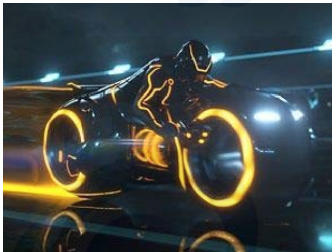
Gambar 1. Tron Legacy , Tangerang

Tron adalah sebuah film fiksi-ilmiah yang menceritakan tentang manusia setengah robot yang berlatarbelakangkan masa depan. Ciri khas dari Tron adalah kostum atau atribut yang digunakan berwarna gelap dengan garis-garis streamline bercahaya biru layaknya kehidupan futuristik. Semua peralatannya canggih dan yang terutama adalah motor balap yang digunakan pada arena pertandingan dalam film itu. Seperti film aksi lainnya, Tron cukup populer dikalangan anak-anak, remaja, bahkan orang dewasa. Tapi khusus untuk anak-anak mereka menyukai Tron bukan hanya dari film, melainkan juga dari game dan mainan action figur -nya.