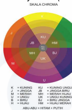
Gambar 5. Macam Warna Skala Chroma (Rasmuses, 1998:47)

Warna dapat didefinisikan secara objektif/fisik sebagai sifat cahaya yang dipancarkan atau secara subjektif/psikologis sebagai bagian dari pengalaman indra penglihatan (Wong, 1986:67). Secara subjektif/psikologis, penampilan warna dapat diberikan ke dalam hue (rona warna atau corak warna), value (keterangan atau terang-gelap warna, tua-muda warna), dan chroma. The color wheel ; the primary colors (blue, red and yellow), the secondary colors (orange, green and violet), tertiary colors are created when primary colors are mixed with adjacent secondary colors, and complementary colors (for example, violet and yellow).