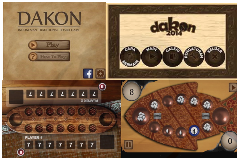
Gambar 7. Dakon Digital

berhitung, alat menaruh sesajen, dan alat menaruh biji kuwuk dalam permainan tradisional. Selain itu adapun simbol merupakan tanda berdasarkan peraturan atau perjanjian yang disepakati bersama bahwasanya dakon ditandai dengan beberapa lubang kecil berjumlah lima, tujuh dan kelipatannya dikuti dua lubang besar disamping papan dakon, hal ini dilakukan baik dari papan dakon dengan material kayu, plastik bahkan digital. Namun jika ditelaah dari sudut warna, terjadi perubahan dalam penggunaan warna papan dakon. Pada material kayu, dan plastik, papan dakon menggunakan warna primer dan warna sekunder (seperti warna merah, kuning, hijau, biru). Berbeda halnya dengan permainan dakon yang terdapat pada digital, pewarnaan lebih menggunakan warna tersier (seperti warna coklat). Bukan saja dari aspek warna, namun juga dari aspek estetika, motif dan corak. Nampak pada papan dakon menggunakan motif dan corak fauna (seperti menyerupai bentuk ikan, dsb), sedangkan pada dakon digital salah satunya menggunakan motif dan corak batik kawung (dengan pewarnaan coklat).