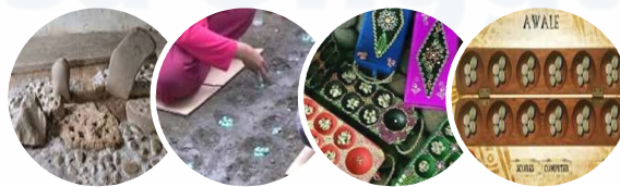
Gambar 6. Pergeseran Dakon

Warna kuning memiliki karakter yakni terang, cerah, gembira. Simbol/lambang warna kuning seperti kehidupan, kemenangan, kegembiraan, kemeriahan. Warna merah memiliki karakter yakni kuat, energik, berani. Selain itu, warna merah secara simbol/lambang memiliki makna keberanian, kekuatan. Warna biru memiliki makna simbol/lambang adalah kecerdasan, perdamaian. Warna cokelat mengandung karakter antara lain, kedekatan hati, bijaksana, hormat. Sedangkan untuk simbol/lambang dari warna cokelat adalah kesopanan, kebijaksanaan, kehormatan.