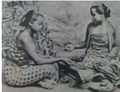
Gambar 4. Dakon sebagai Permainan Puteri Keraton

Berdasarkan filosofi yang dimiliki oleh dakon yakni sebagian masyarakat Jawa dipercaya sebagai permainan anak-anak (khususnya anak perempuan Keraton) yang berada di dalam istana dan tidak diperkenankan bermain di luar istana tanpa didampingi. Sehingga muncul persepsi bahwa diduga dakon dirancang sebuah desain dengan menggunakan material bahan kayu, berbentuk kepala naga, diperuntukan bagi anak-anak keraton. Lain halnya, dengan anak-anak dari rakyat biasa memainkan dakon dengan membuat lubang-lubang dakon pada media alam (tanah) seperti dua (ibu) lubang besar di sebelah kanan dan kiri yang ditambahkan dengan lubang-lubang kecil berjumlah ganjil (lima, tujuh, sembilan dan seterusnya).