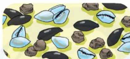
Gambar 2. Kuwuk

Papan congklak mempunyai sepasang dengan tujuh lubang kecil yang saling berhadapan dan dua lubang besar di ujung-ujungnya. Setiap pemain berhak atas tujuh lubang kecil dan satu lubang besar di sisi kanan pemain. Selain itu, diperlukan sembilan puluh delapan kuwuk sebagai biji congklak. Dalam permainan dapat menggunakan biji sawo, kulit kerang atau kerikil kecil sebagai kuwuk. Setiap lubang kecil diisi dengan tujuh kuwuk.