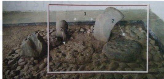
Gambar 1. Lokasi Prasasti Batu Dakon, Kabupaten Bogor

dijelaskan oleh masyarakat setempat sebagai sarana adat dan kehidupan melalui kegiatan upacara ritual keagamaan.