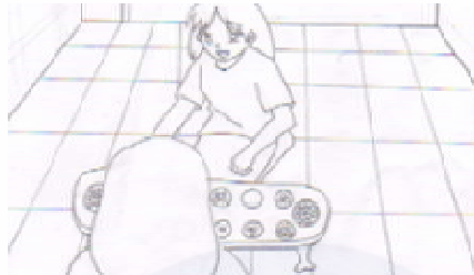
Gambar 2. Anak-anak sedang bermain dakon

Pemberian nama berbeda-beda pada dakon menjadi tanda dan simbol yang dimiliki oleh masing-masing etnis. Di Indonesia, masyarakat Jawa mengenal dakon sebagai permainan dengan sebutan congklak , dakon , dhakon atau dhakonon . Di Lampung, dakon dikenal dengan sebutan dentumanlamban . Di Sulawesi, permainan dakon disebut dengan mokaotan , maggaleceng , aggalacang dan nogarata . Umumnya masyarakat hanya mengetahui dakon merujuk pada permainan yang dimainkan oleh remaja dari bangsawan Jawa. Di Indonesia dakon dimainkan pada gender perempuan yakni bagi remaja putridan anak-anak perempuan (yang berusia sekitar 5 tahun sampai dengan usia 13 tahun).