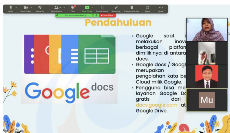
Gambar.2 Pelaksanaan Pelatihan